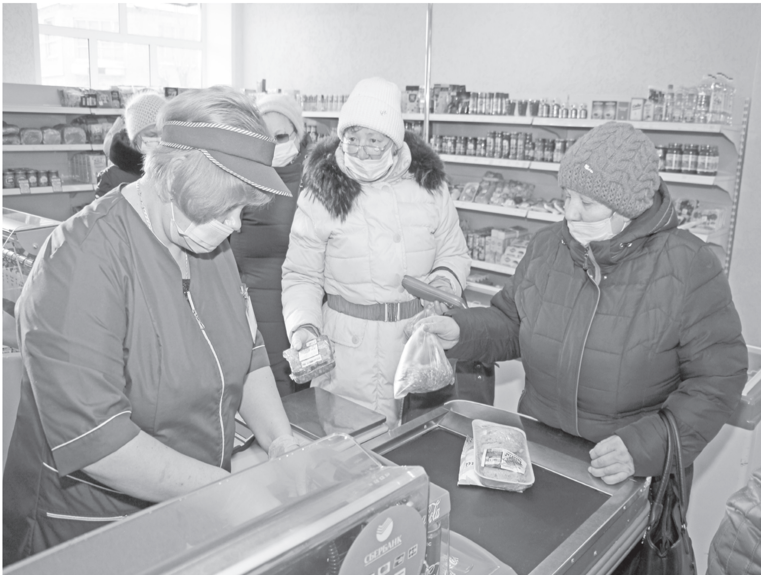
Первые покупатели знакомятся с ассортиментом нового магазина.