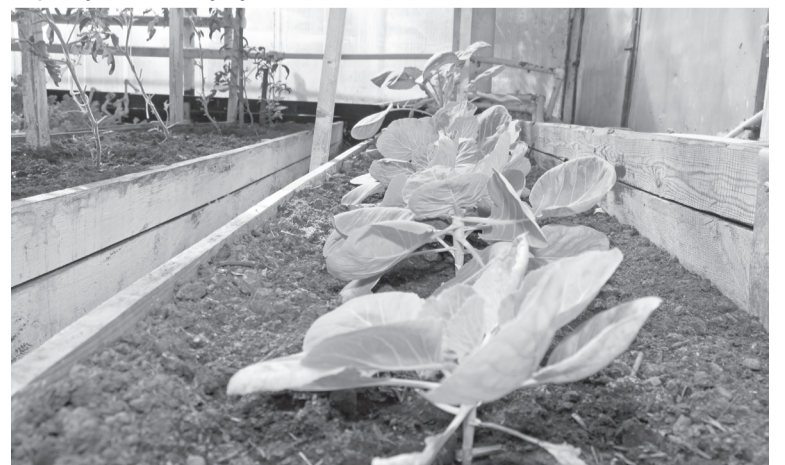
В феврале начинается посев многих культур.