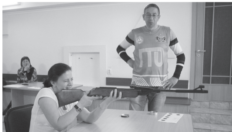
Сладковцы активно сдают нормативы ГТО.

Павел ХАРАПОНОВ, специалист ДЮСШ «Темп»