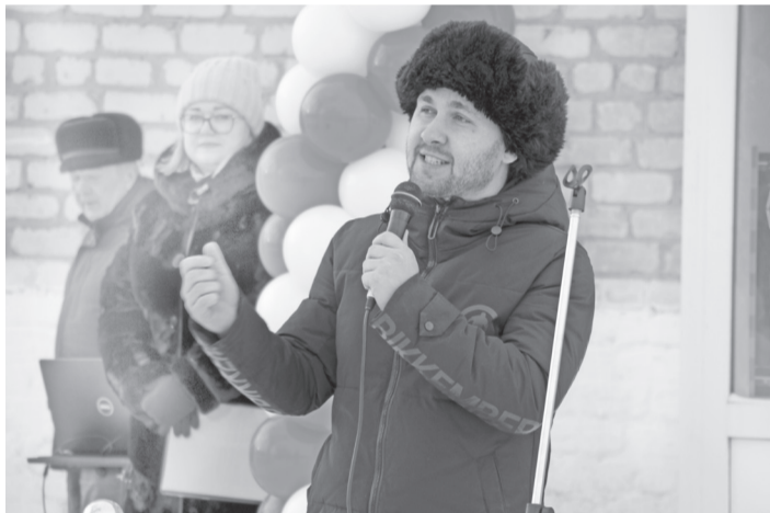
Моменты праздничного дня.

Торжественное открытие магазина с продукцией «Согласия» состоялось в минувшую пятницу. На мероприятии присутствовали глава Сладковского района, представители и учредители торговых марок, представленных на прилавках и витринах. В числе почётных гостей – советник губернатора Тюменской области Александр Анохин, который длительное время возглавлял наш муниципалитет и Заводоуковский городской округ. Обращаясь к сладковцам, он отметил, что коллектив ООО «Согласие» –