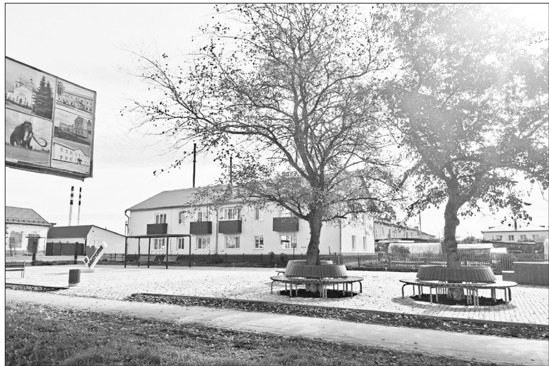
Новое благоустроенное пространство - сквер «Юность»