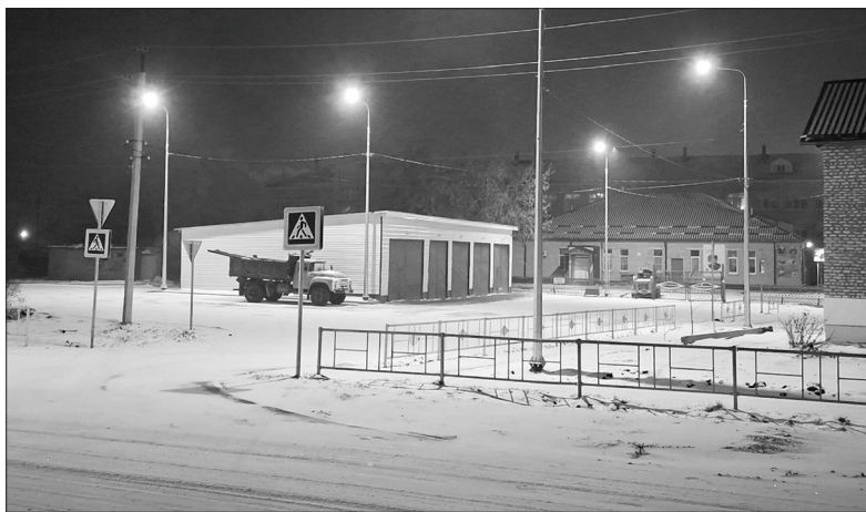
Автомобильная стоянка возле Абатской СОШ №2

сферах экономики. Общая сумма инвестиций составит более 80 миллионов рублей, будет создано около 40 рабочих мест.