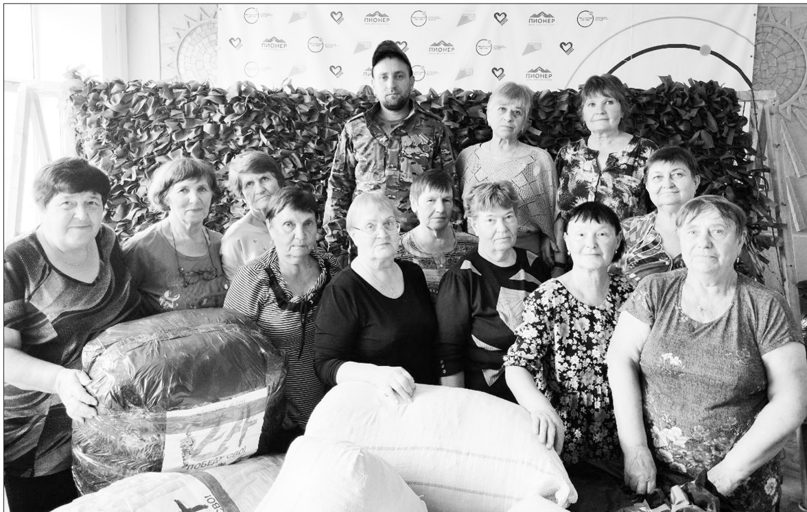
Волонтёры помогают бойцам СВО