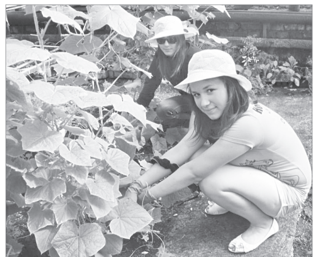
Особенно много ребят желают потрудиться во время летних каникул

Активно занимаемся трудоустройством юношей и девушек из «группы особого внимания».