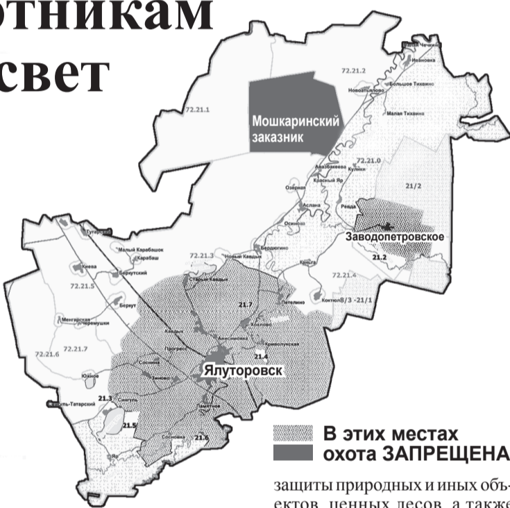
В этих местах охота ЗАПРЕЩЕНА

- Само понятие такой зоны появилось ещё в сороковых годах прошлого века. Леса эти предназначены для защиты людей от неблагоприятных природных и