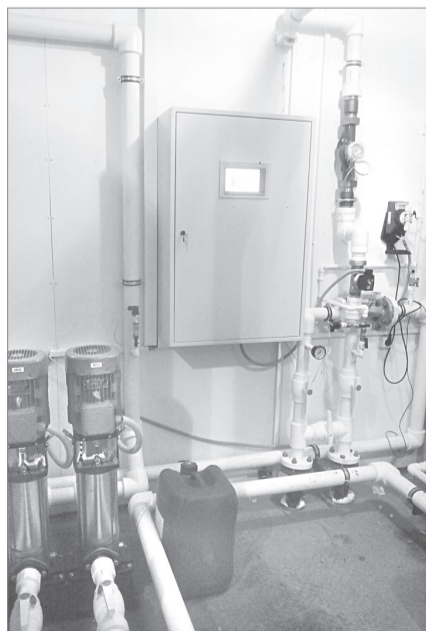
Вся система очистки воды автоматизирована и не требует постоянного контроля

Это стало возможным благодаря установке специально-