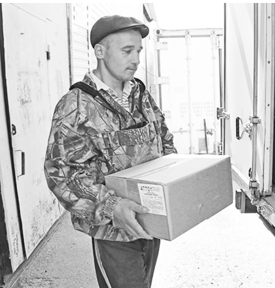
* На оптовой базе