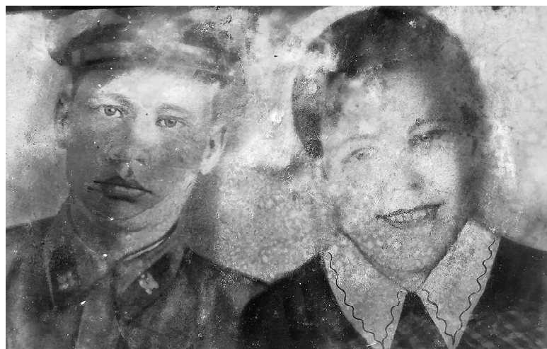
Единственный сохранившийся снимок молодых супругов