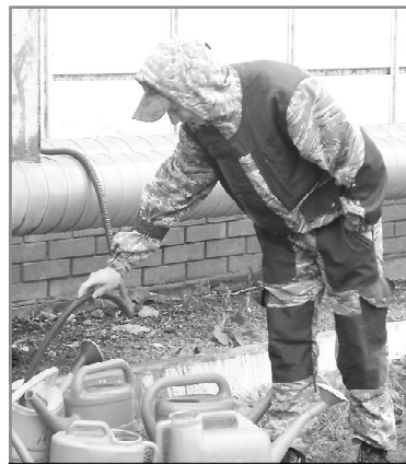
Без воды - и не туды, и не сюды

Вооружившись диктофоном и фотоаппаратом, мы отправились в парк райцентра, чтобы