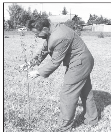
На аллее ветеранов

Бригада по благоустройству в это время трудилась по обе стороны от моста: вручную выкашивали заросли сорной травы. Занятие, надо заметить, трудоёмкое, так как лопухи и крапива вытянулись в человеческий рост, этому благопри-