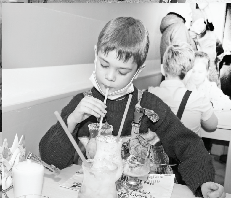
Юные сладковцы довольны открытием места семейного отдыха.