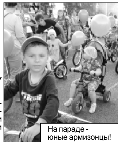
На параде — юные армизонцы!