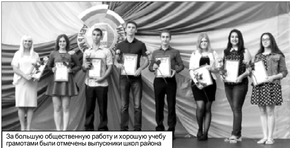
За большую общественную работу и хорошую учебу грамотами были отмечены выпускники школ района