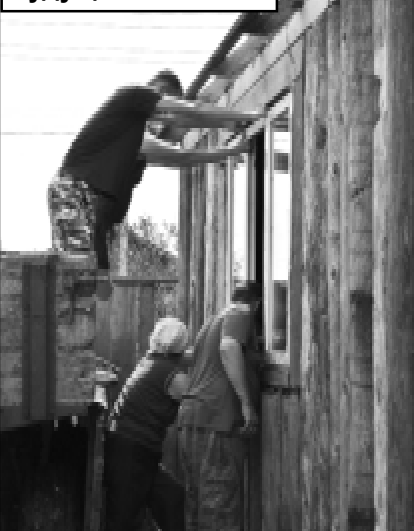
Строительство будущего магазина