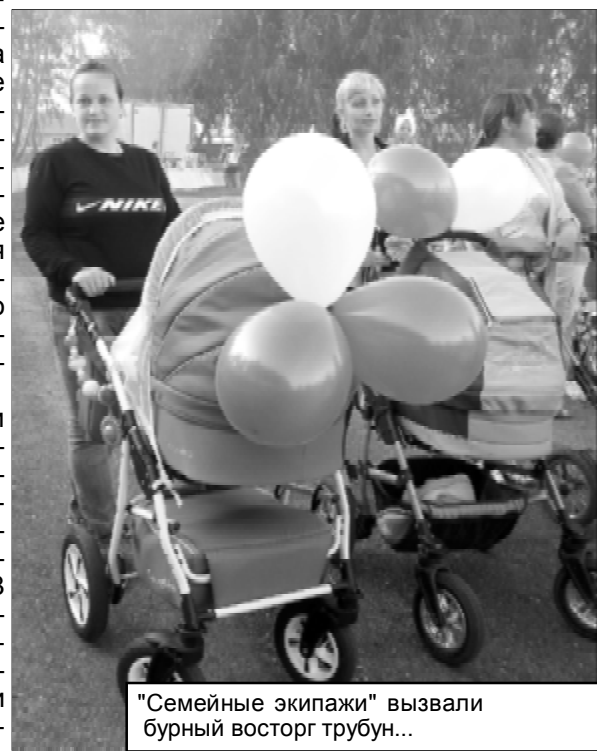
"Семейные экипажи" вызвали бурный восторг трибун...