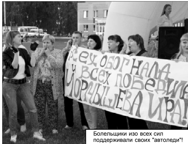
Болельщики изо всех сил поддерживали своих "автоледи"!