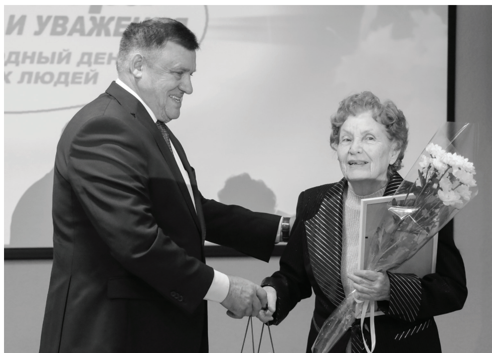
День добра и уважения – повод еще раз сказать сердечное спасибо всем людям старшего поколения. За мудрость и любовь к родной земле, за сохранение традиций.

– Всю жизнь вы трудились на благо Ишима и сегодня не просто в строю – в авангарде общественной жизни. Мы с гордостью перенимаем ваш колоссальный опыт служения родному городу. С честью выполнили вы и другую задачу – воспитали достойное поколение, передали им такие важные качества, как патриотизм, ответственность и отвага. Сегодня те мобилизованные ребята, которых мы с тяжелым сердцем проводим в зону специальной военной операции, говорят: «Не переживайте, не волнуйтесь, мы выполним свой долг, победим и вер-