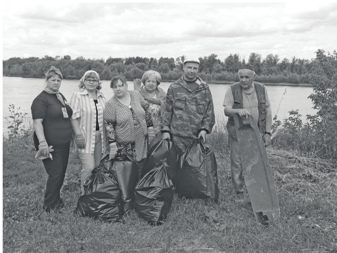
«Улов», что в мешках, прямо скажем, не из самых приятных, но «кайф» от выполненной работы, от земной чистоты, реки и открывающихся красот так и «прёт».

26 июня в Нижней Тавде прошла экологическая пятница, целью которой было объединение наших граждан, организаций и органов государственной власти в движении за защиту окружающей среды от последствий негативной деятельности человека, привлечение внимания общественности к проблеме обращения с бытовыми отходами, оказание реальной практической помощи окружающей природе, создание благоприятных условий для жизни нынешнего и будущего поколений.