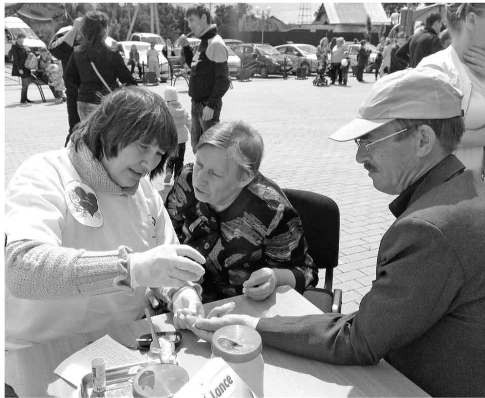
Узнать сахар крови – нужное дело.

Для работы в таком формате были отобраны медицинские работники с креативным мышлением, высококвалифицированные, умеющие организовать себя и заинтересованные в результатах. Работало три бригады. Две из них – на площади возле ЦК и Д; по определению сахара крови экспресс-методом и информационный (рекомендации по правильному питанию, по борьбе с курением, профилактике ВИЧ-инфекции, туберкулеза, инфаркта, инсульта, раздача буклетов по профилактике заболеваний). Третья бригада работала в дискотечном зале ЦК и Д. Здесь медицинскими работниками проводилась экспресс-диагностика ЭКГ, здесь измеряли АД, рост, вес, окружность талии и давалась консультация врача общей практики. Предложен-