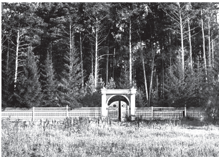
• Так выглядел Колмаковский парк на рубеже XIX и XX веков.

Алексей СЕВЕСТЬЯНОВ Фото автора и из архива Заводоуковского краеведческого музея