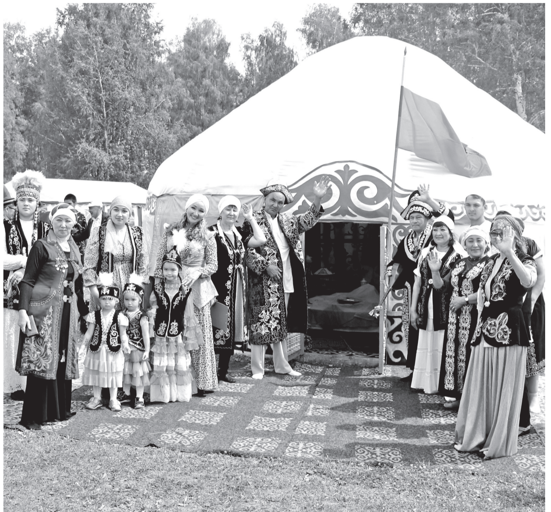
• Добро пожаловать! Заводоуковская юрта – серебряный призёр конкурса национальных подворий Курултай казахов России.

В посёлке Центральном прошёл Курултай казахов России. Заводоуковская земля приняла делегации из 18 субъектов нашей страны и всей Тюменской области.