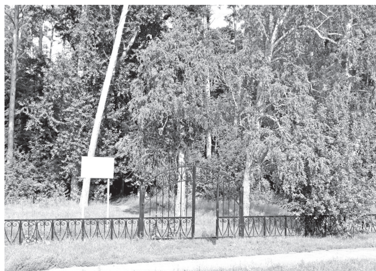
• Памятник природы регионального значения. Наши дни.