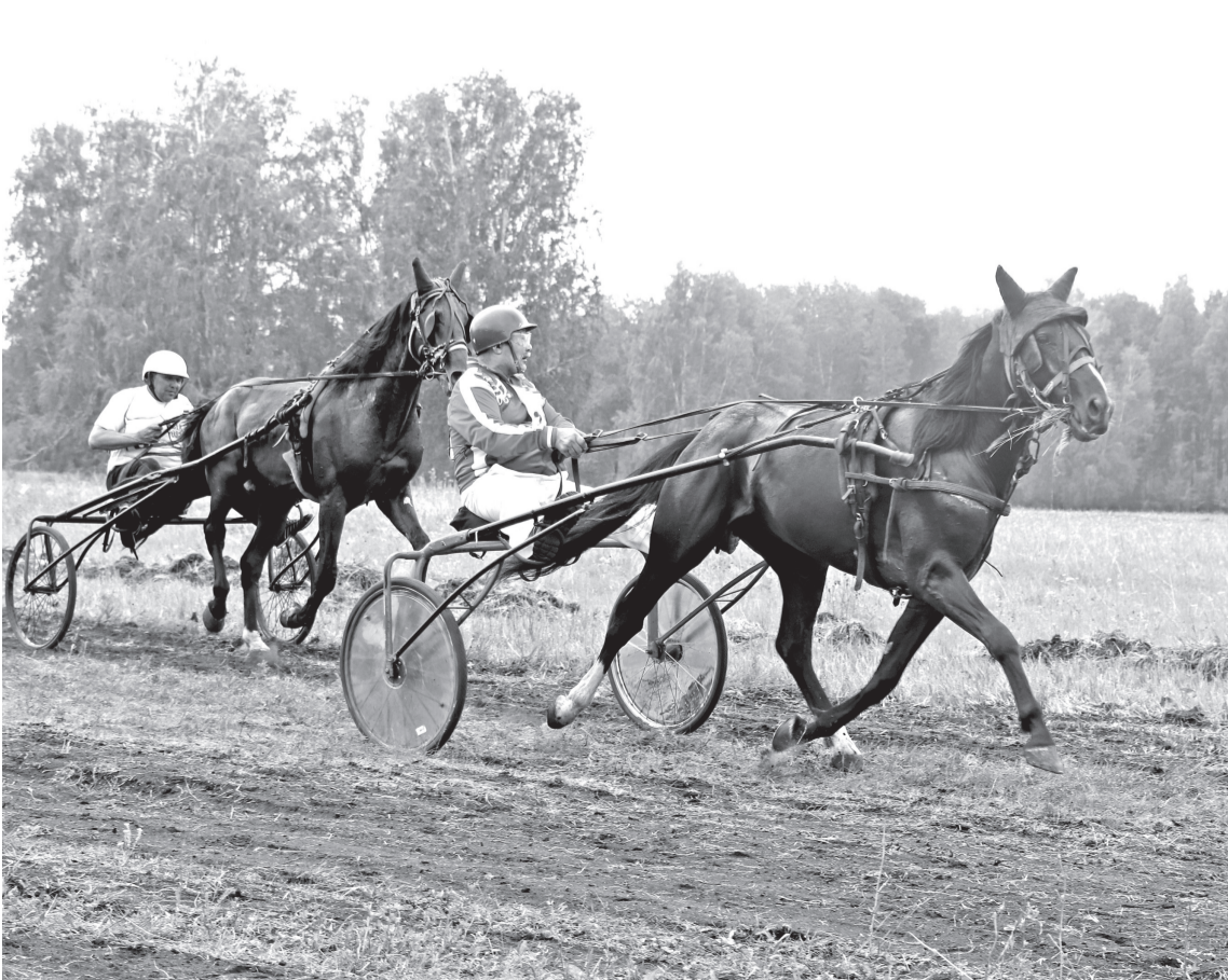
• Бега на конноспортивном турнире проходили с огнём и азартом.