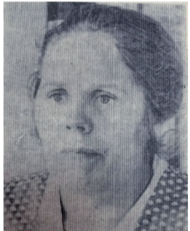
газета «Коммуна», 1972 год