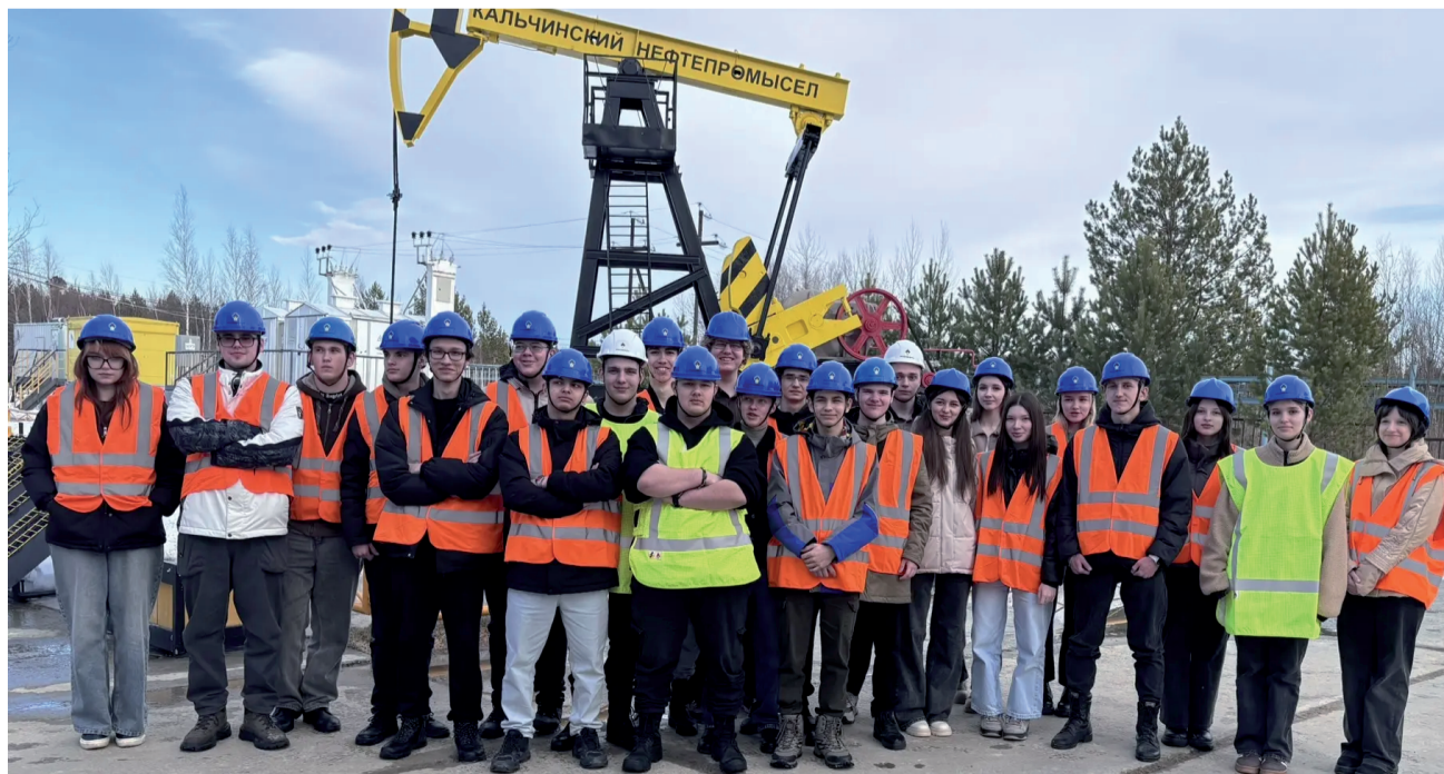
11 «А» на Кальчинском месторождении.

Анастасия ДЕНИСОВА