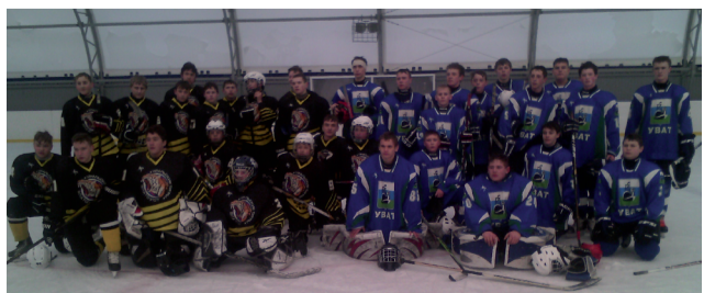
газета «Уватские известия», 2015 год

В начале марта команда «Уват» приняла участие в зональных соревнованиях Урала и Западной Сибири по хоккею на призы клуба «Золотая шайба», которые прошли в городе Барнауле Алтайского края. Выступление на зональном уровне пусть не принесло громкого успеха, но послужило уроком для уватских спортсменов.