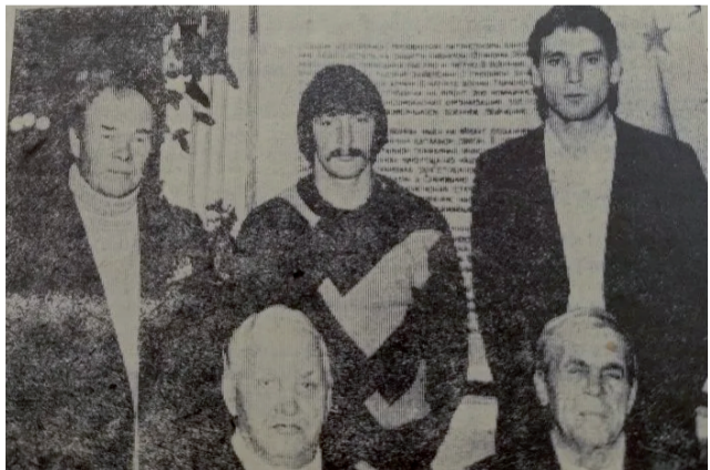
Ветераны Великой Отечественной войны и войны-интернационалисты.

Широкую работу по изучению истории родного края проводит поисковый отряд «Югра» Туртасской средней школы. В результате походов, встреч, работы в архивах, переписки с ветеранами здесь накоплен богатый материал. Всё это используется для проведения экскурсий, встреч с интересными людьми.