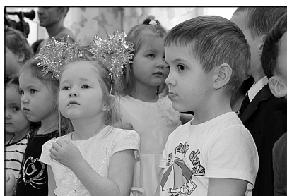
9 января ребята придут в обновленный детский сад.

По словам Натальи Филипповой, ремонт здания обошелся бюджету в 30 млн рублей, не считая оснащения кабинетов и групп. Сертифицированы кабинет медработника и новый пищеблок. За питание яровских дошкольников, как и школьников, отвечает комбинат питания «Магия вкуса», проверенный партнер многих «столичных» школ и дошкольных учреждений. К 9 января, а в этот день «Теремок» откроет двери для воспитанников, все необходимые