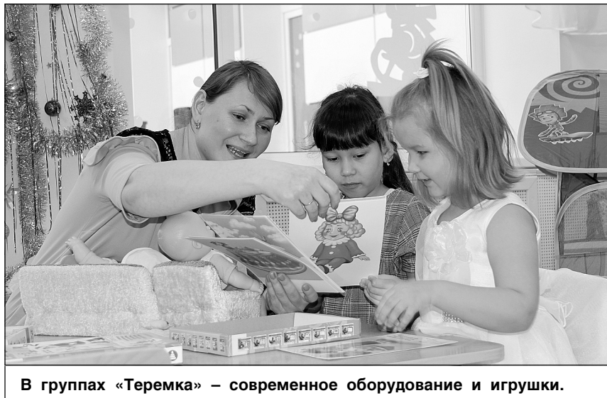
В группах «Теремка» – современное оборудование и игрушки.

Новая крыша и полы с подогревом тоже добавляют эстетики и теп-