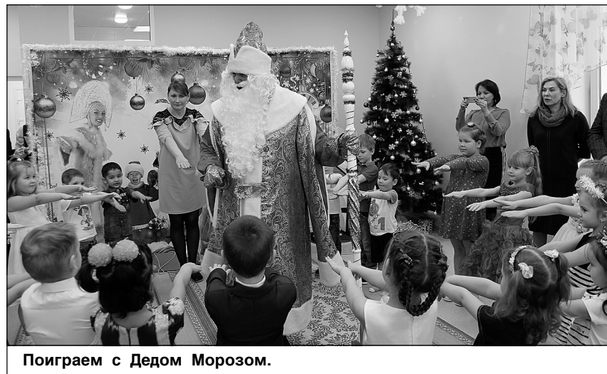
Поиграем с Дедом Морозом.