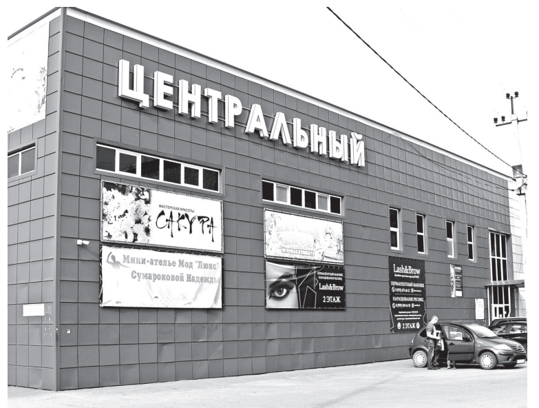
• Кафе, магазин, ателье, салон красоты — в торговом центре «Центральный» заводоуковцев обслуживают по первому разряду.