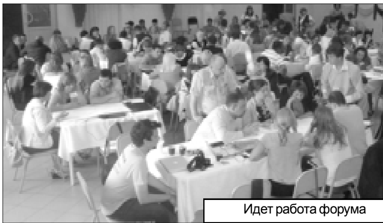
Идет работа форума