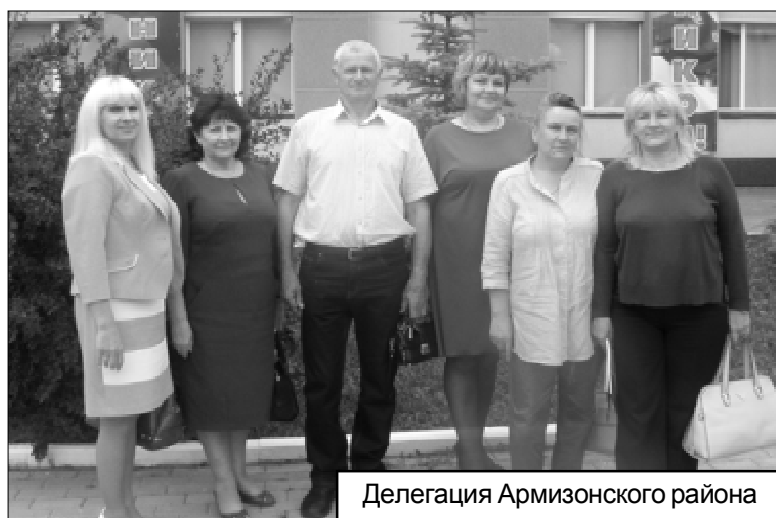
Делегация Армизонского района