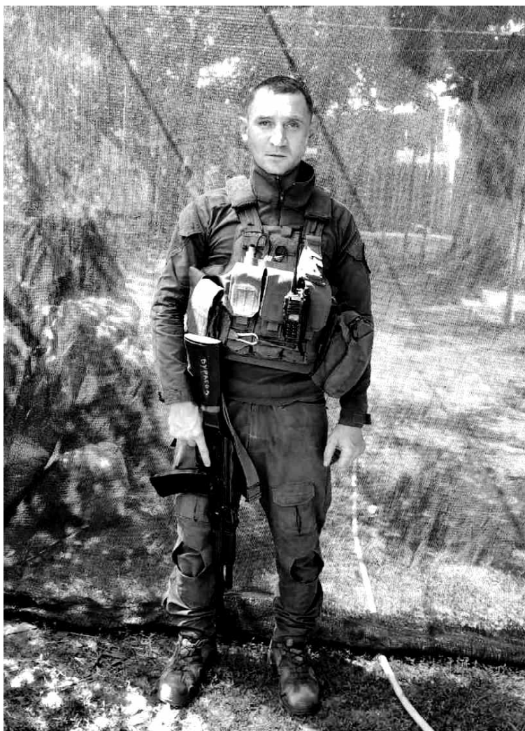
➤ Михаил Коротаев

В 2022 году Михаила мобилизовали на СВО. Попал в 91 сапёрный полк. Служил