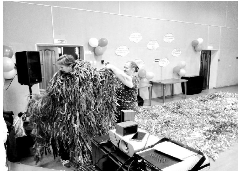
➤ Примерка костюма лешего

С недавнего времени женщины начали плести не только сети, но и специальные маскировочные костюмы и нащлемники. Тринадцать костюмов уже отправили по назначению, три ещё ждут отправки.