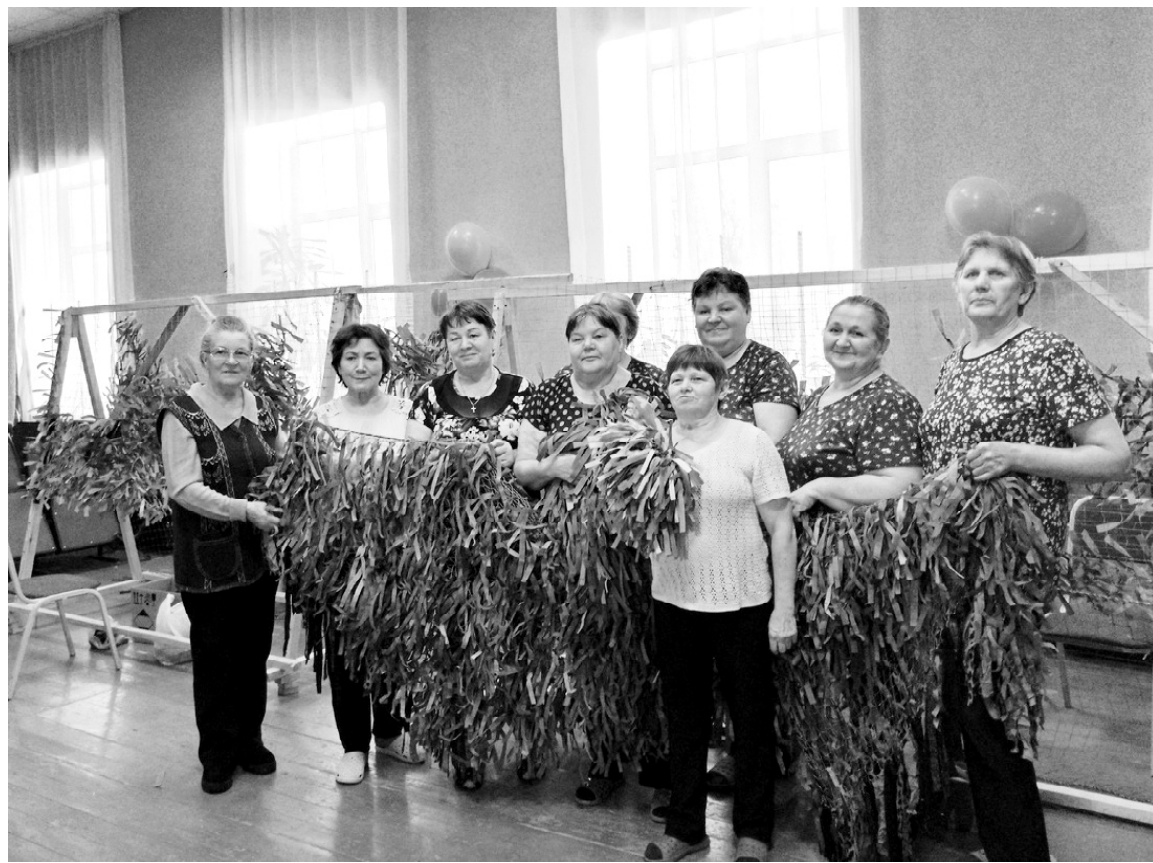
➤ Сартамские добровольцы // Фото автора