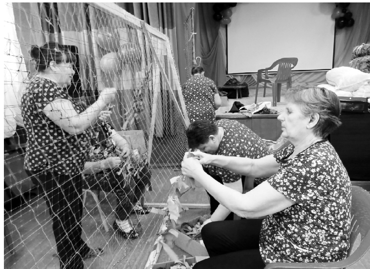
➤ Плетение сетей