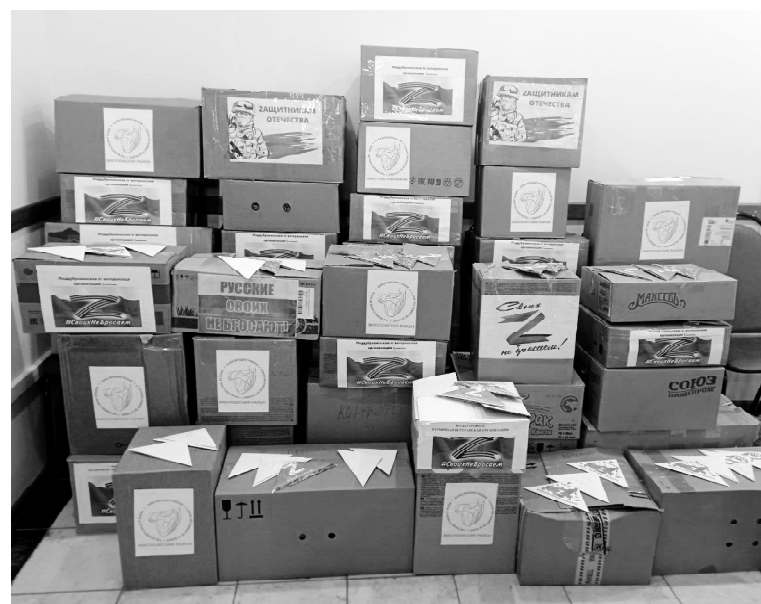
➤ Гуманитарная помощь готова к отправке

– Викуловчане приносили сладости к новогоднему столу, которым мы думаем, обязательно обрадуются наши ребята. Передали тёплые вещи. Представители ветеранского движения своими руками изготовили банные принадлежности. Принесли лекарственные препараты, постельные принадлежности для госпиталей. Активное участие в сборе гуманитарной помощи принимали ученики наших школ. Они писали трогательные и тёплые письма для военнослужащих. Надеемся, что эти посылочки