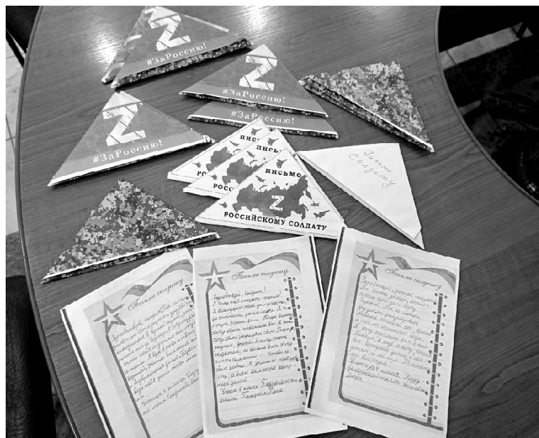
➤ Письма солдатам

С тех пор как началась специальная военная операция на Украине, жители нашей страны сплотились и всеми возможными способами поддерживают своих героев: плетут маскировочные сети, вяжут носки, шьют постельное бельё.