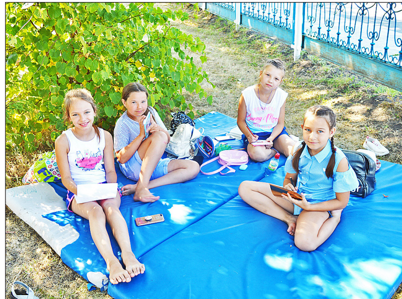
На свежем воздухе дети играют в подвижные игры, рисуют и пишут заметки для стенгазеты