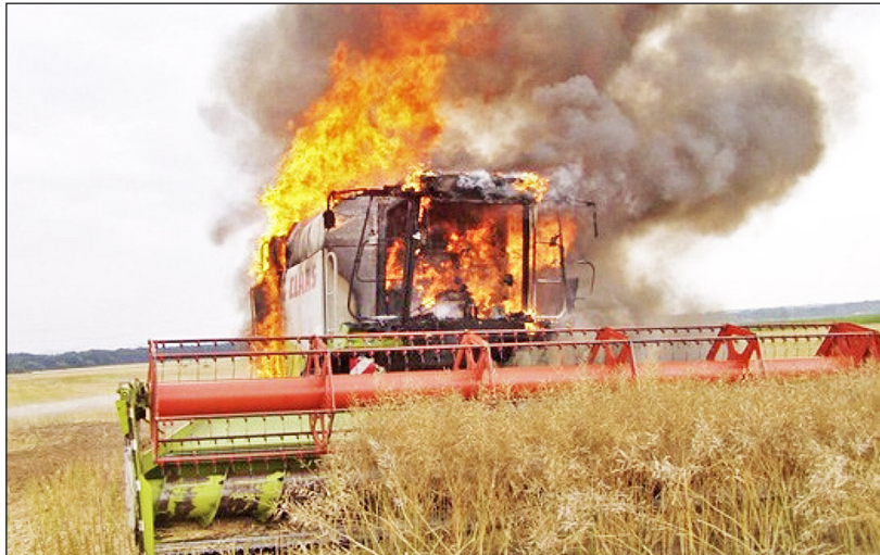
Последствия пожара можно измерить деньгами, но человеческие жизни – бесценны

Информацию подготовила Надежда ДОГОТАРЬ