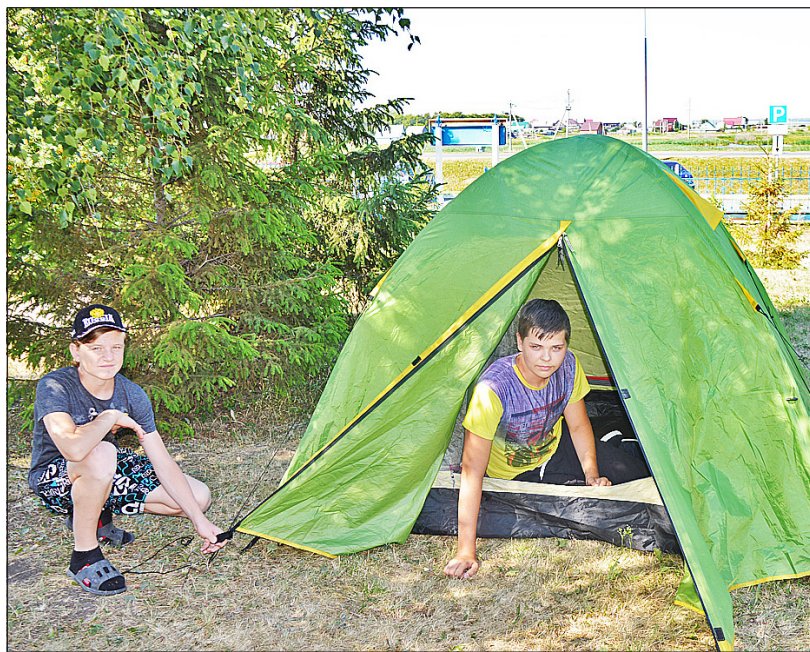
Правильно поставить каркасную палатку подростки учатся на территории школьного двора

Отдельные спальни для девочек и мальчиков оборудовали на каждом отряде, независимо от того, какое количество человек его посещает. Все помещения школы, заде-