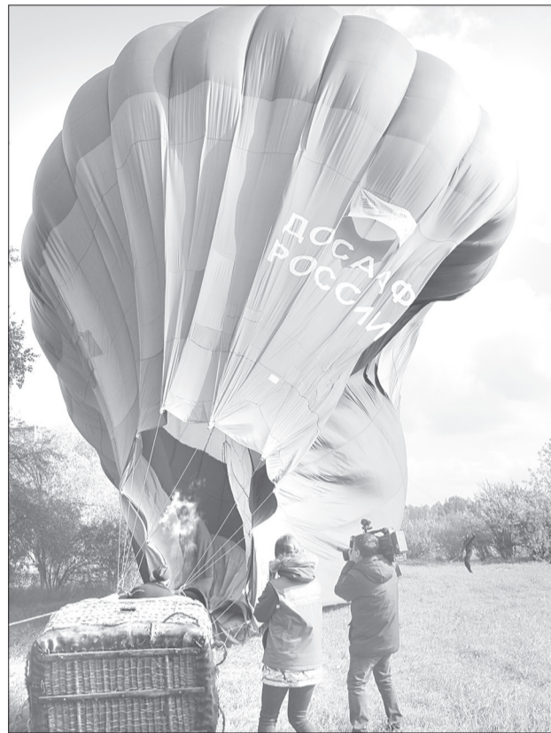
Аэростат с символикой ДОСААФ России

- Получать такую награду за отца - очень неожиданно. Спасибо! Участникам соревнований желаю хороших прыжков и пусть победит точнейший! - обратилась девушка к собравшимся.