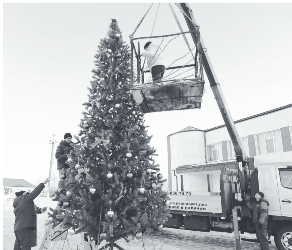
Суерцы в этом году первыми установили искусственную ель.

В этом деле у нас активно участвуют и дети, начиная с воспитанников детского сада. Они делают рисунки и поделки, школьники пишут письма, вместе со взрослыми собирают посылки, плетут сети, изготавливают наборы «сухого душа». Несколько раз устраивали благотворительные концерты и ярмарки, на которых мы собирали до четырёхсот тысяч рублей. В том числе, благодаря перечислениям земляков, которые проживают за пределами района. Неоднократно отправляли технику, транспортные средства в зону проведения специальной военной операции.