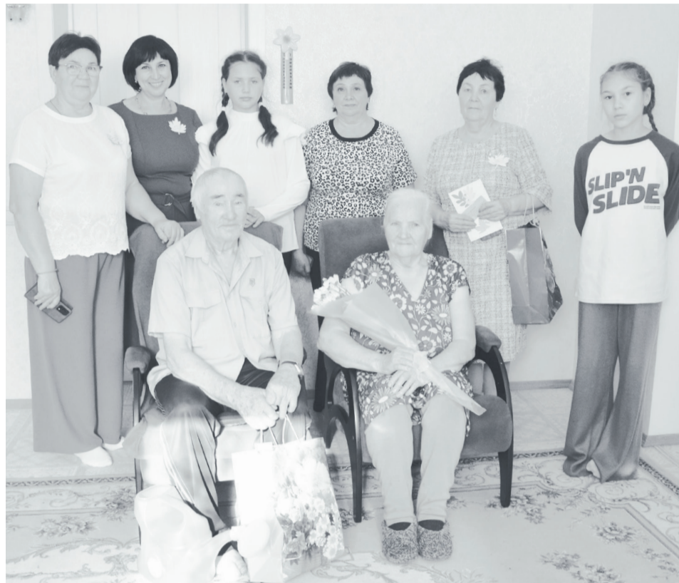
Каждый год суерцы поздравляют пенсионеров с Днём пожилых людей и дарят им памятные подарки.

– Ежегодно наши спортсмены, работники культуры и активные жители участвуют в соревнованиях и конкурсах, занимают призовые места и прославляют наш край. Администрация также не остаётся в стороне.