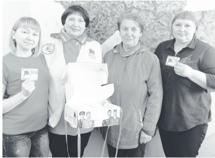
Участники акции «Красная звезда».

«Серебряные» волонтеры настолько активны, что трудно назвать сферу, где они не принимают участие. Добровольцы помогают в проведении многих сельских мероприятий, участвуют в соревнованиях, выставках, осуществляют присмотр за детьми, постоянно собирают гуманитарную помощь жителям Курска и Донбасса, вяжут носки для военнослужащих СВО, плетут маскировочные сети, шьют стропы, делают окопные свечи, передают бесценный опыт молодому поколению, успевают заниматься спортом, писать о своей деятельности