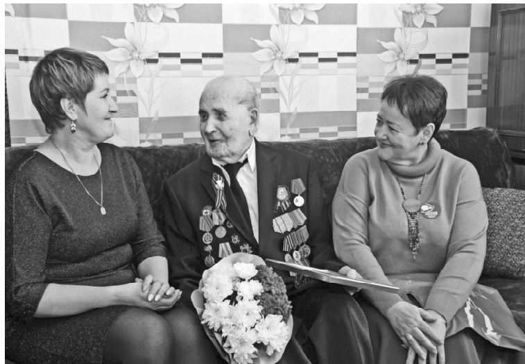
➤ В гостях у Анатолия Трофимовича Кожевникова