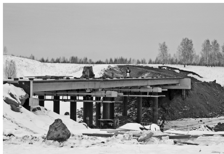
➤ Мост на Красную Елань