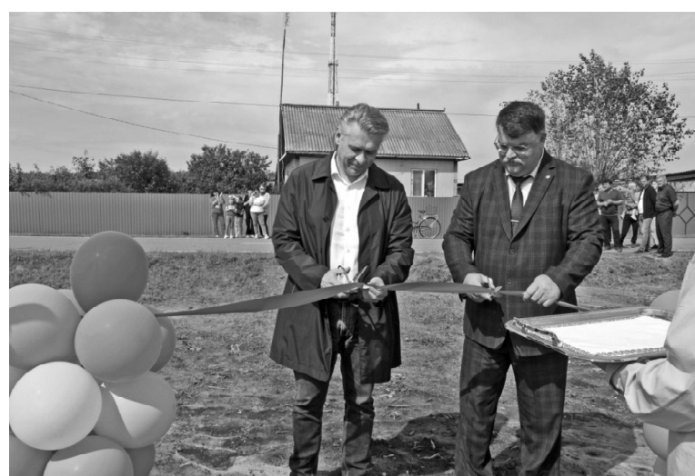
➤ Открытие детской площадки в с. Коточи

В Викулово торжественно открыли Год защитника Отечества. В фойе РДК во время мероприятия сплели маскировочную сеть для бойцов СВО.