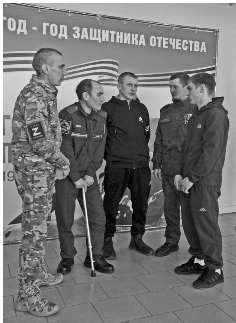
➤ Открытие Года защитника Отечества