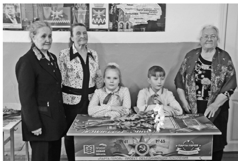
➤ «Парта Героя» в Поддубровном

лово открыли памятник землякам, погибшим на СВО.