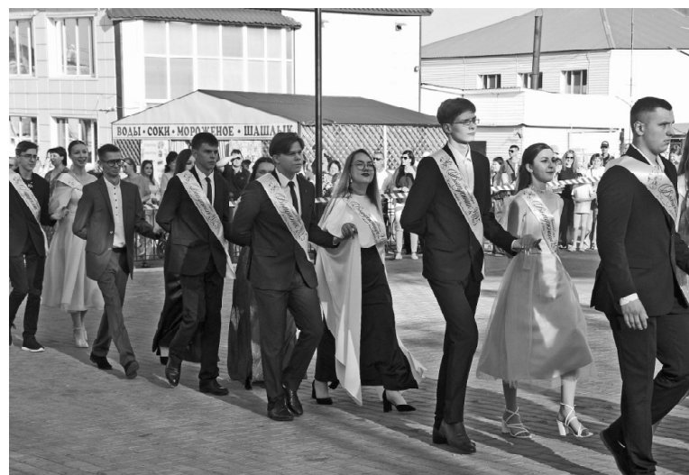
➤ Выпускники – 2025