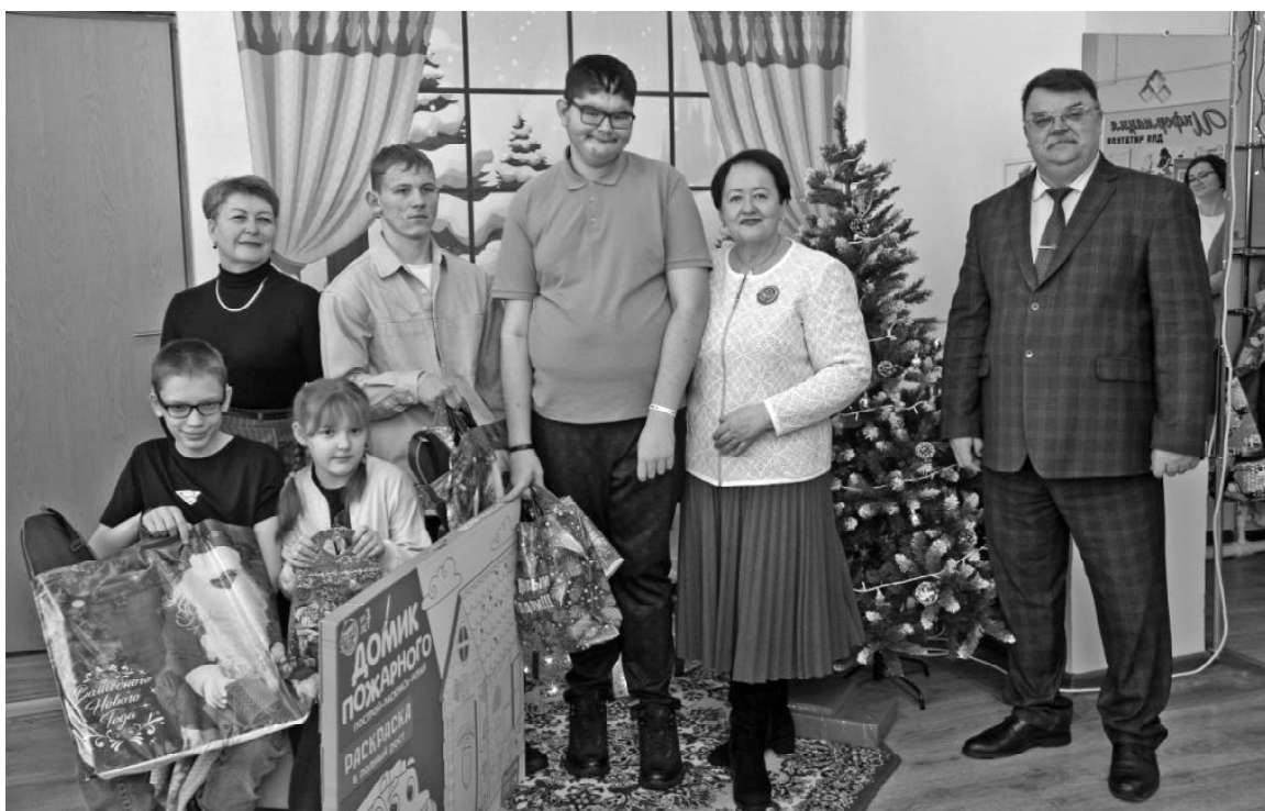
➤ «Ёлка желаний» в детской библиотеке