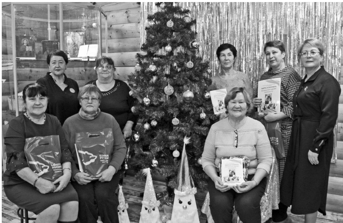
Участники проекта «Жить и помнить. Материнские судьбы» в Викуловском музее

Викуловский народный краеведческий музей имени А.В. Давыдова завершил год 80-летия Победы в Великой Отечественной войне, презентовав альбом «Жить и помнить. Материнские судьбы», который собирали по крупицам жители округа. Это истории женщин, которые, несмотря на все тяготы войны, оставались сильными, заботливыми, трудолюбивыми и не теряли веру в лучшие времена, в счастье, в любовь, в справедливость. Истории тех, кто, будучи в тылу, работал день и ночь, чтобы обеспечить фронт всем необходимым. Это напоминание о том, что за каждой победой стоят конкретные люди, их судьбы, их жертвы. И наш долг – передать эту память будущим поколениям!