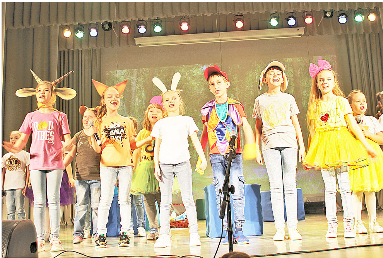
«Только дружба, наша дружба не исчезнет никогда!» — под таким девизом прошло дебютное выступление младшей группы объединения «Наш театр»

Как оказалось, совместная деятельность сближает, и артисты крепко сдружились, так что перед началом и после репетиций не скучали, а с удовольствием коротали время