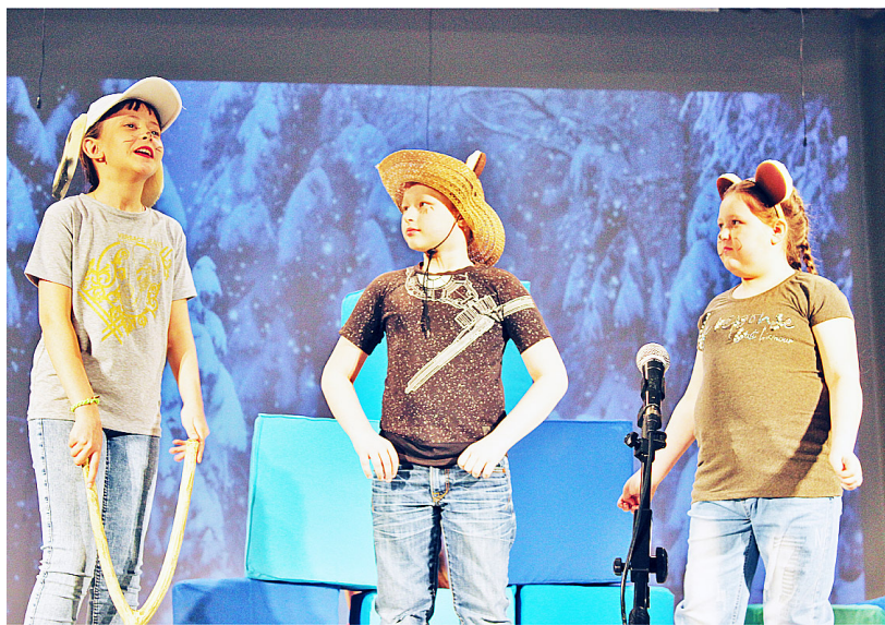
Собака, Бык и Медвежонок в исполнении казанских школьников получились весёлыми и убедительными