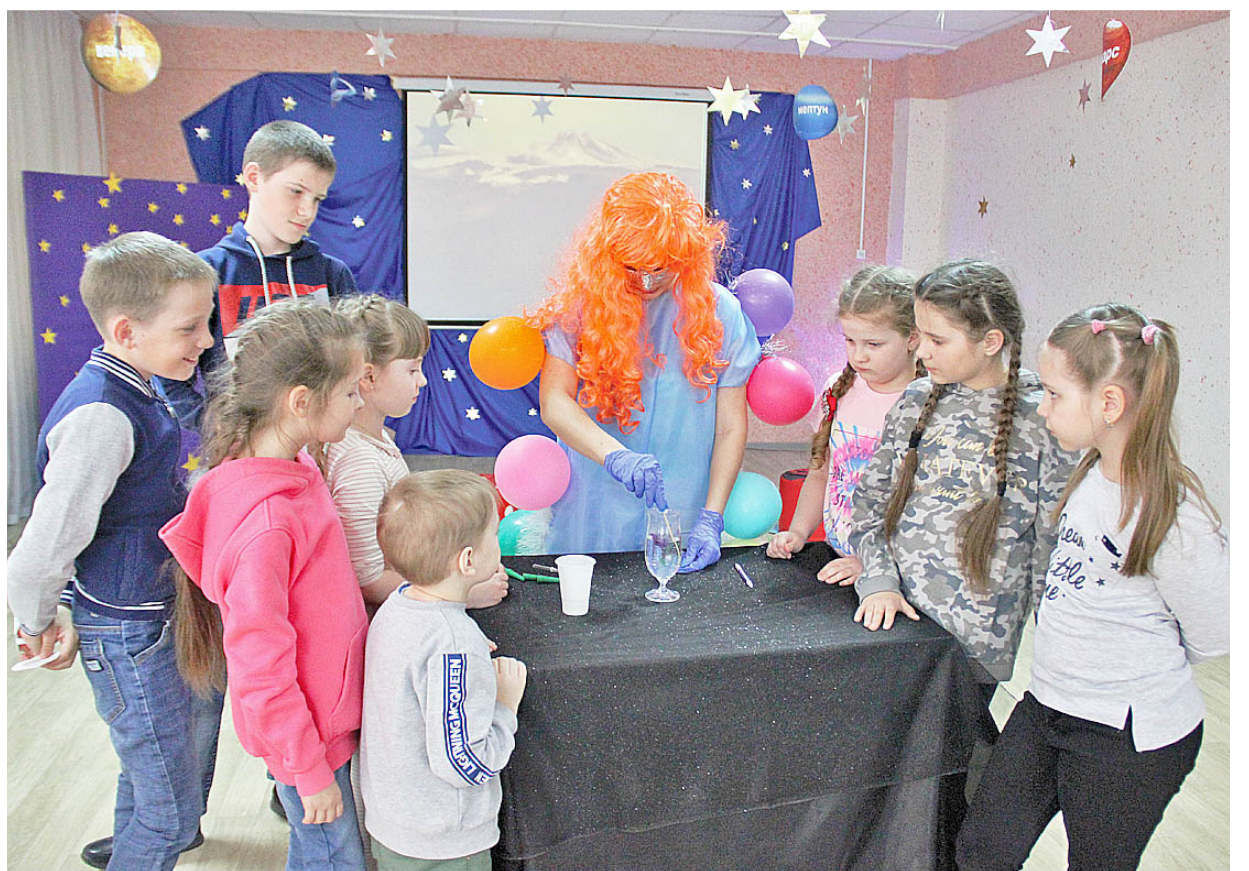
Детям особенно понравились космические опыты, которые проделывал инопланетный гость