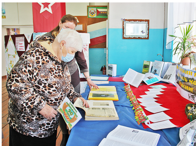
Привлекла внимание участников мероприятия книжная выставка