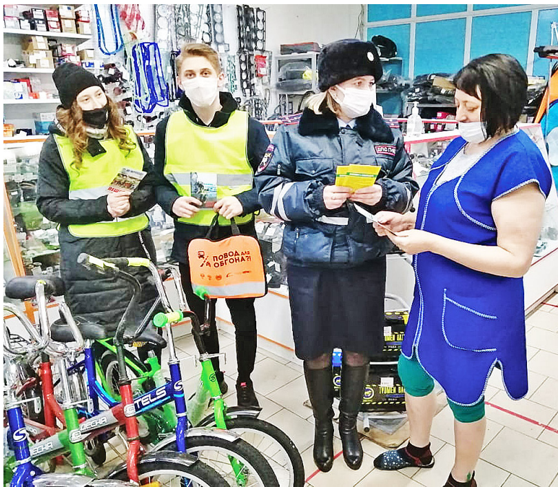
Безопасность детей на дороге – забота всех взрослых

С целью предупреждения дорожно-транспортных происшествий с участием юных велосипедистов, а также с учётом того, что приближаются летние каникулы, активисты дорожной безопасности совместно с госавтоинспекторами провели пропагандистскую акцию #Велобезопасность.