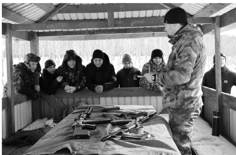
Ребятам предстояло на скорость снарядить магазин АКМ