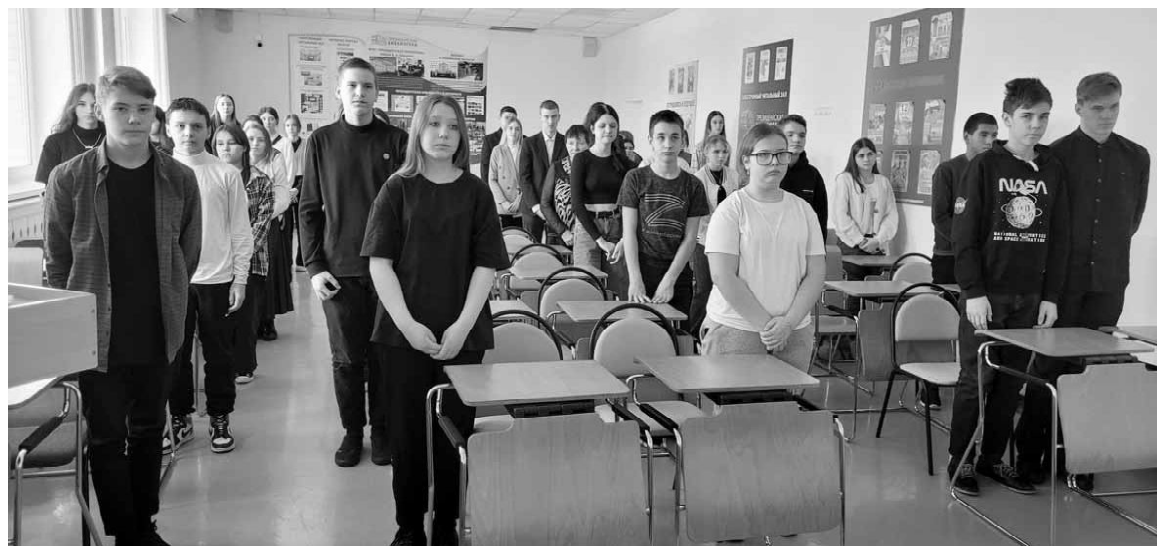
Учащиеся Омутинской СОШ № 2 почтили память воинов минутой молчания

Нина АБРОСИМОВА, председатель районного совета ветеранов