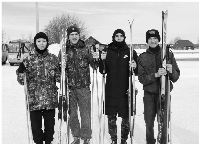
Группа «Лидер» стала победителем