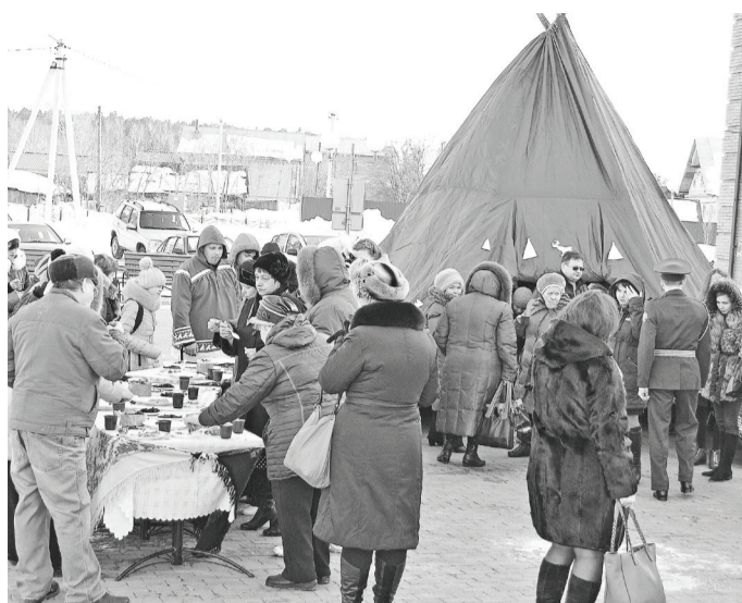
Возле чума было многолюдно.