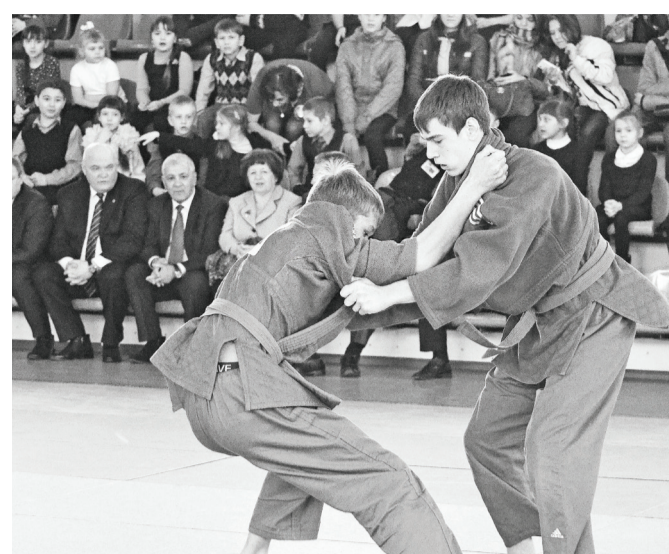
Зал спорткомплекса полон. Ах, как болели за наших!

«Сударыня Конда» – так называлась концертная программа наших северных соседей, посмотреть которую собралось столько желающих, что пришлось использовать дополнительные приставные места. Артисты поразили зрителей профессиональным исполнением и прекрасными костюмами. Один коллектив сменял другой: народный вокальный ансамбль «Журавушка», вокальный ансамбль «Звонница», образцовый художественный коллектив-студия «Данс