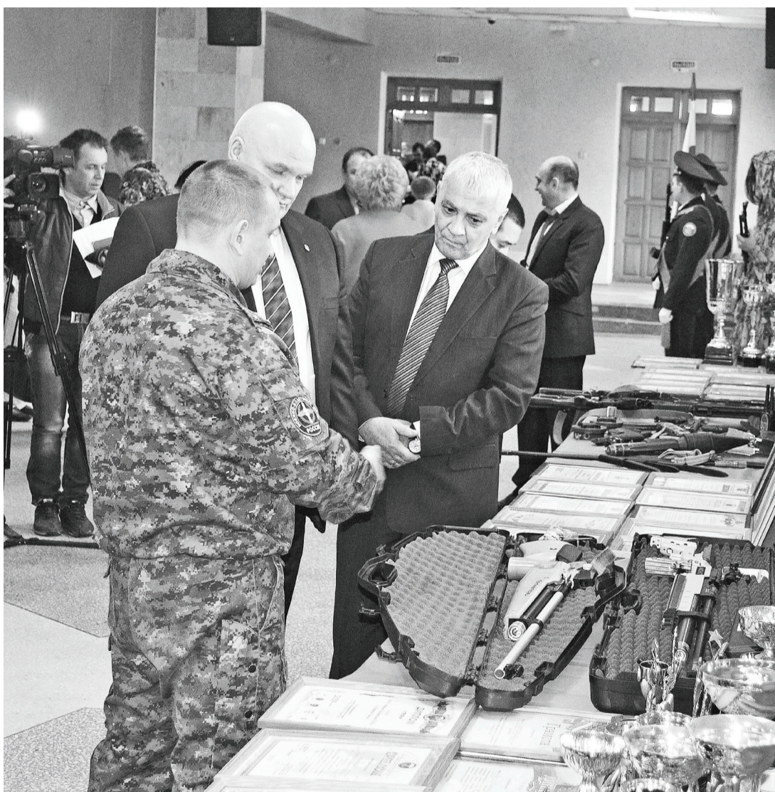
Нижнетавдинским кадетам есть что показать и о чём рассказать.