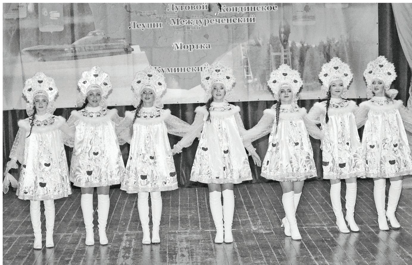
Если бы вы смогли увидеть этих красавиц наяву!