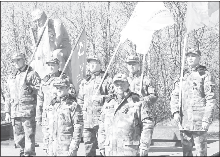
Из поисковой экспедиции отряд вернётся 11 мая