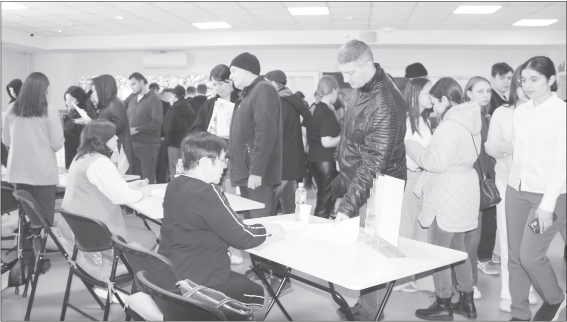
Некоторые соискатели приходили с направлениями от ЦЗН и сразу попадали на мини-собеседование