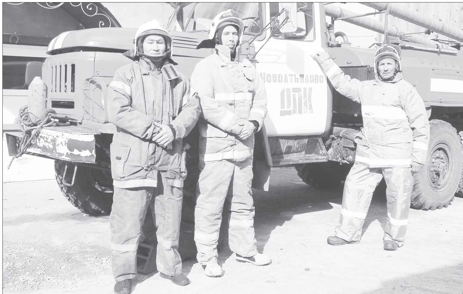
Добровольные пожарные в Новоатъялово обеспечены автомобилем, форменной одеждой и необходимым оборудованием

Добровольные пожарные команды минимизируют угрозы пожароопасного сезона