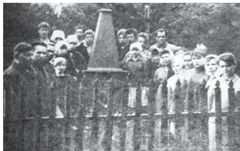
Торжественный митинг у братской могилы (1967 г.).