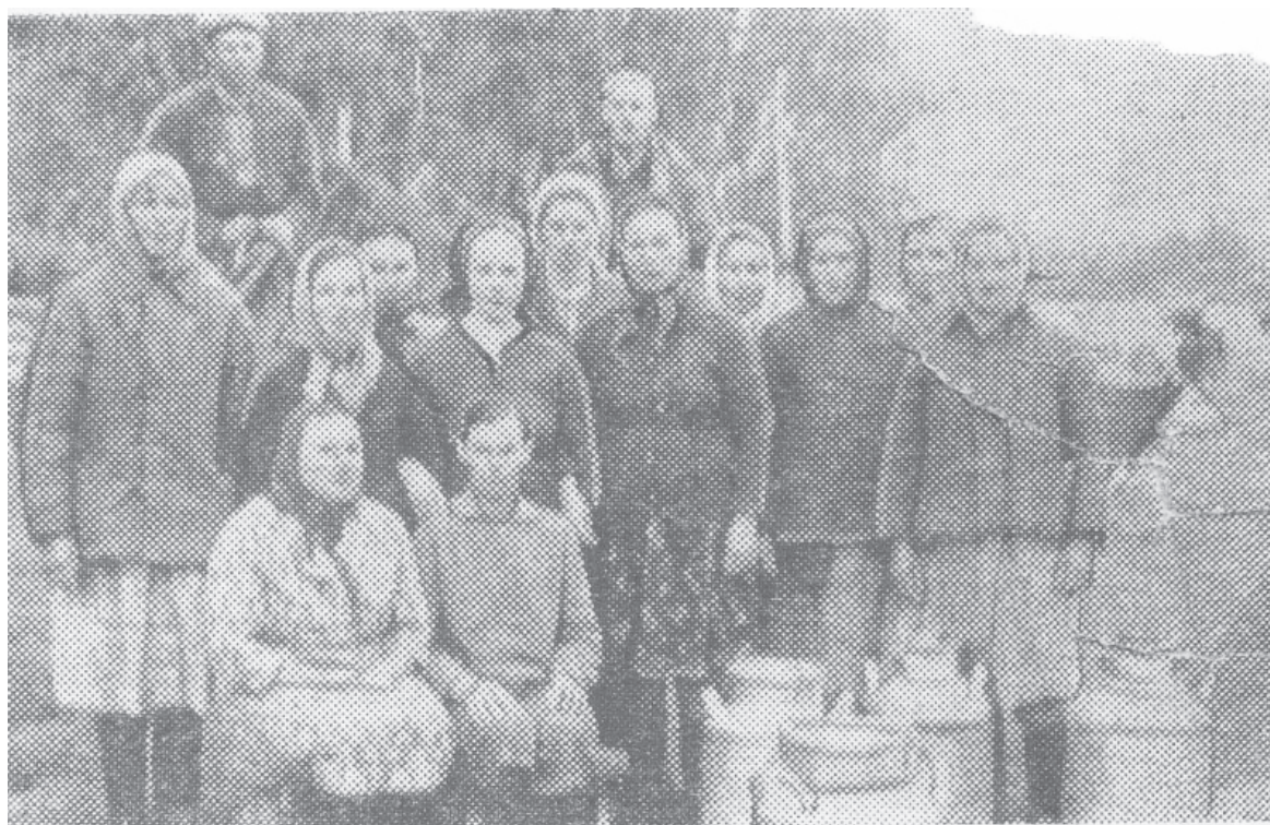
Коллектив доярок и скотников Осинниковской фермы.

Правлением колхоза был разработан план электрификации сел и деревень. К началу 1959 года была запущена электростанция в деревне Верхний Роман. Электричество пришло в дома и на фермы колхозников. Весной было запланировано строительство электростанции и в Осиннике.