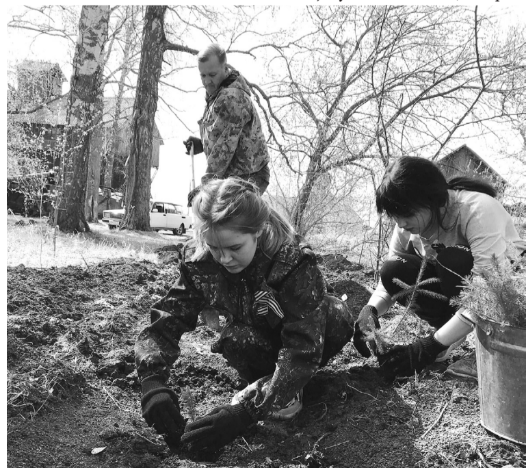
Дети высаживают "Сад Победы"

Из-за засушливой погоды мелеет река. А это в сложный пожароопасный период, каким стал 2021 год, чревато последствиями. Гидротехнических сооружений на водоёме нет, трубы проложены ещё в советские времена, они закрыты. В прошлом году с помощью районной администрации построили дамбу для переезда. Но дождей нет – и воды в реке нет.