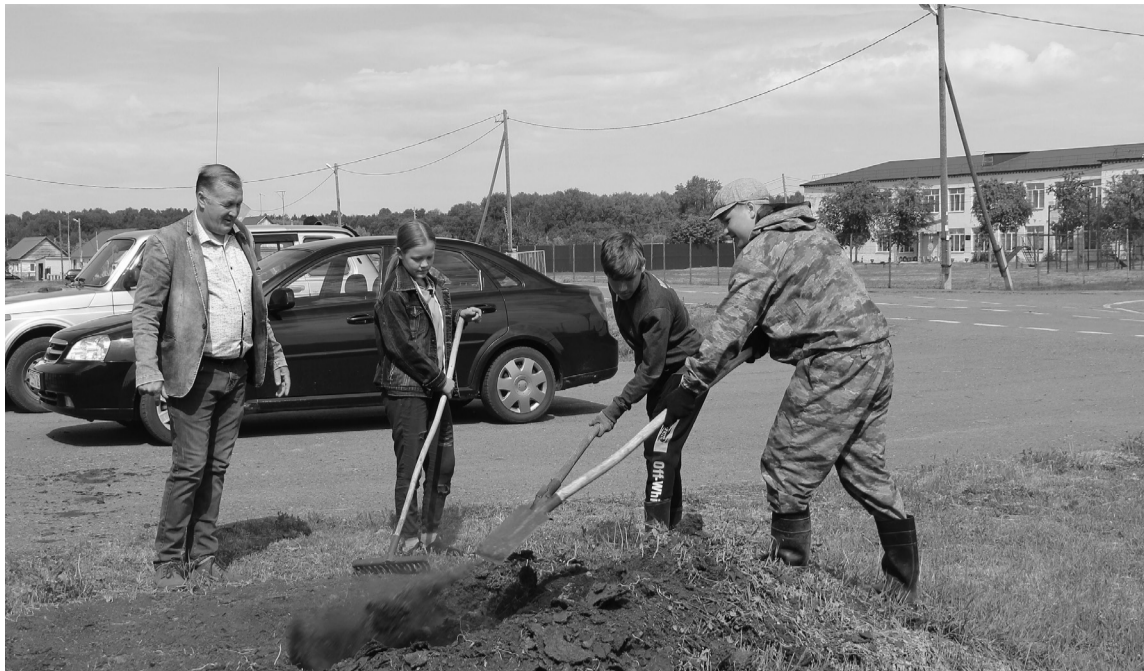
За работой трудовой отряд главы поселения

Активную поддержку в решении вопросов местного значения оказывают депутаты сельской Думы. Сегодня к обязанностям председателя Совета приступила моло-