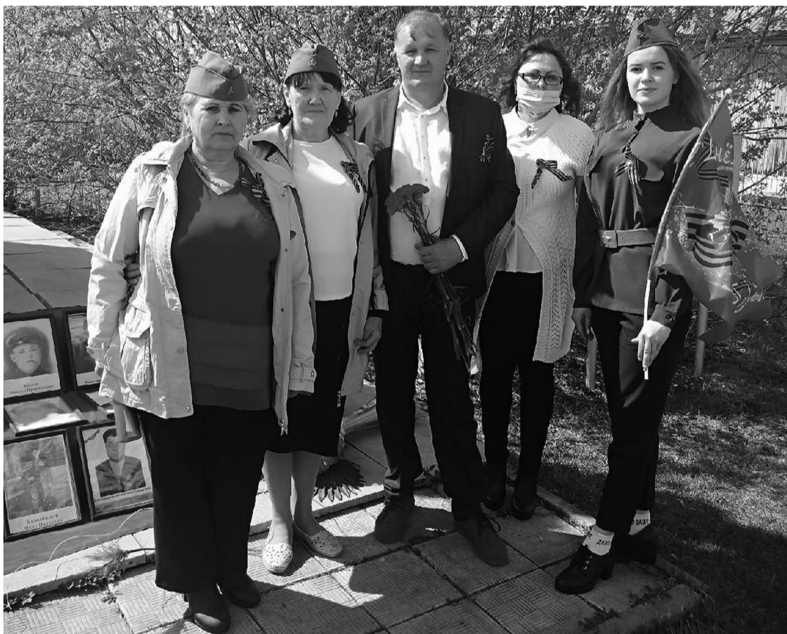
На снимке: пинигинцы на праздновании Дня Победы