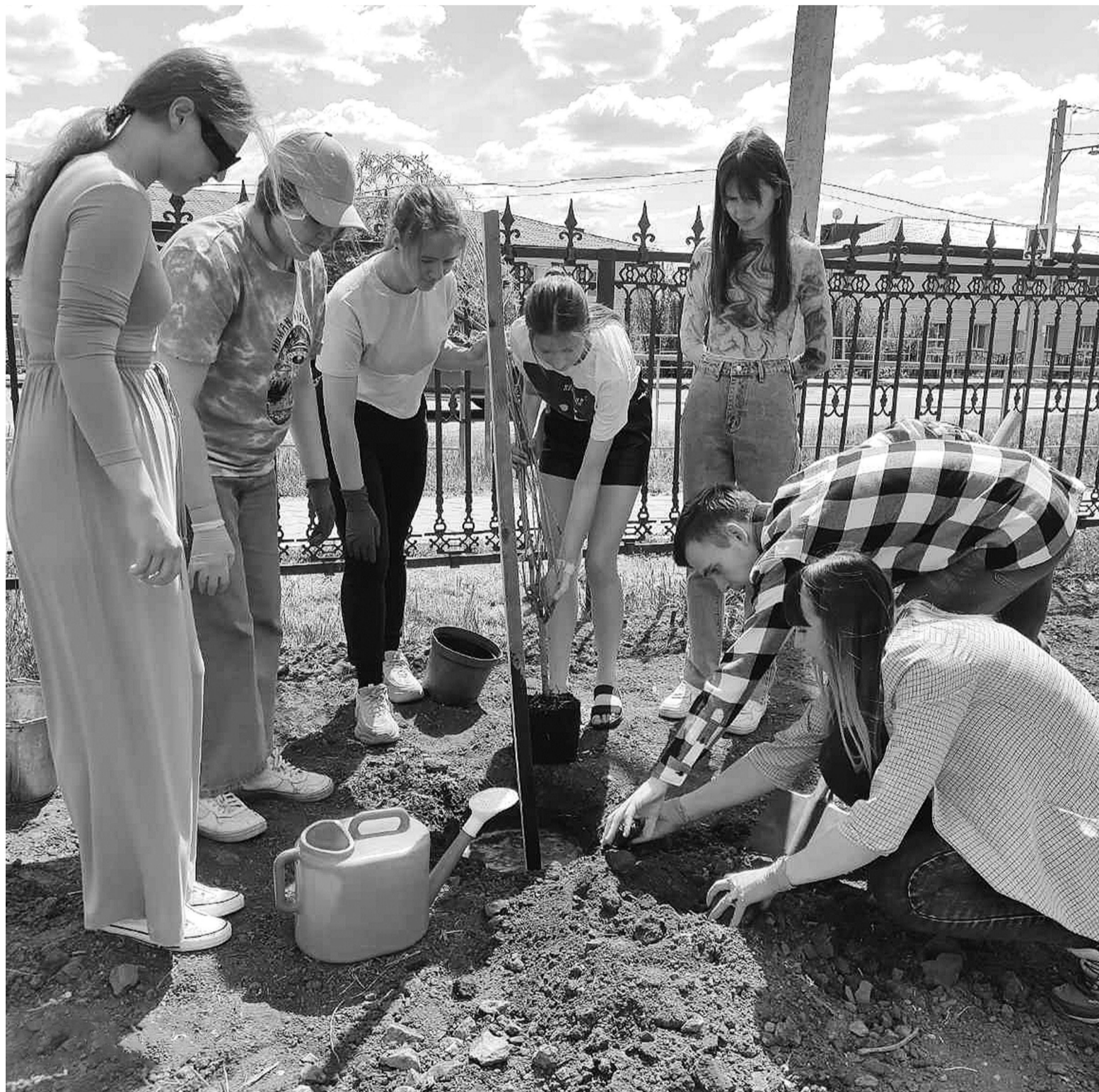
Аллею в Сорokinской школе №1 закладывают выпускники 2021 года

хорошо прижиться. В условиях по-настоящему южной жары, которая властвует в этом году на территории области, это проблематично, поэтому ель временно затеяют... В вечернее время все саженцы обильно проливают, чтобы дать им укорениться на новом месте. Все манипуляции с новыми растениями выполняются с душой, а иначе саженцам просто не прижиться.