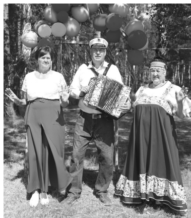
Музыкальная семья Поповых встречает гостей «Одинского разгуляя»

Местные жители и общественники из соседних сёл и деревень провели мероприятие с приглашением профессиональных и самодельных артистов нашего округа.