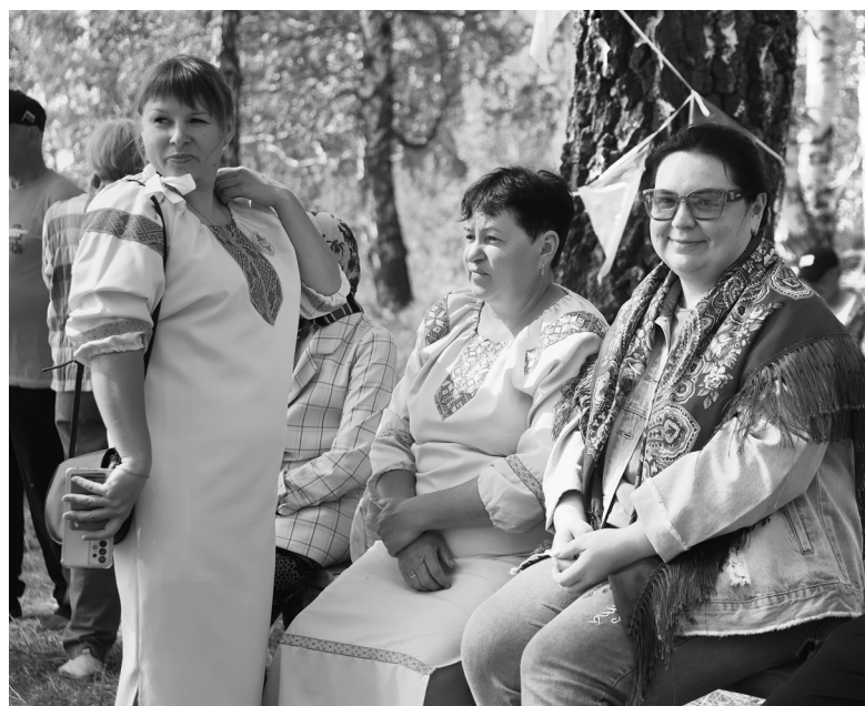
На праздник деревни – только в народном костюме

Наталья ГЛАДКОВСКАЯ