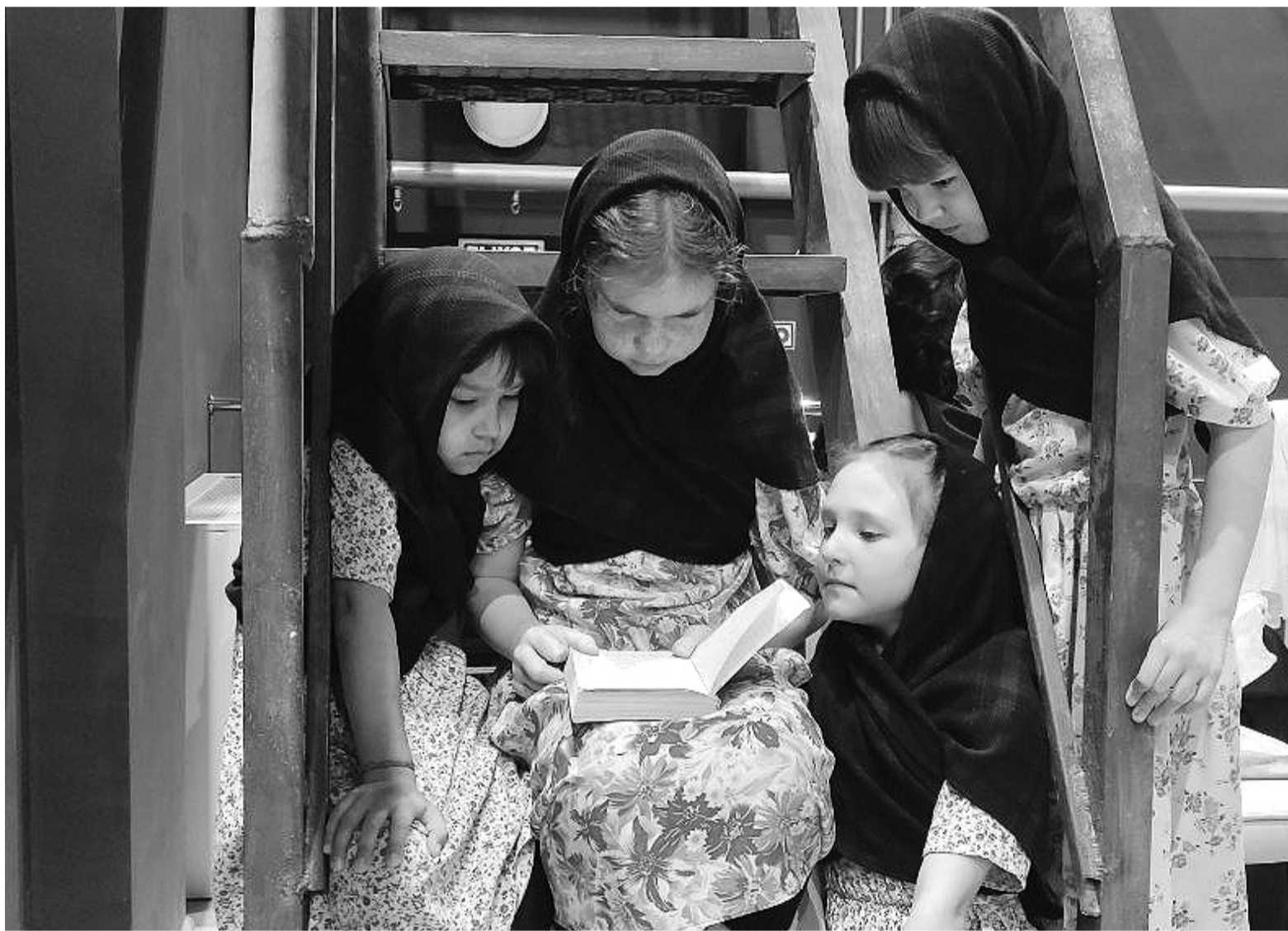
Маленьких блокадниц в спектакле сыграли сорокинские школьницы

Крупным планом. Вспоминаем подвиг Ленинграда: как город выстоял в нечеловеческих условиях