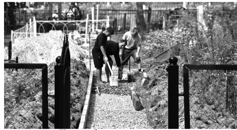
На кладбище появился тротуар

Напомним, что и жители райцентра активно включились в процесс приведения погоста в порядок. Добровольцами приведено в порядок большое количество заброшенных могил.