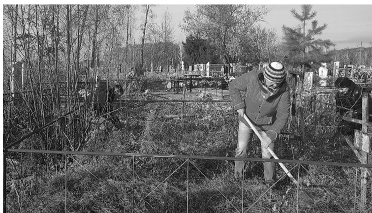
В уборке заброшенных могил принимали участие все желающие

– Обсудив всё то, что сделано в уходящем году на кладбище, члены Общественной палаты пришли к единому мнению: рабо-