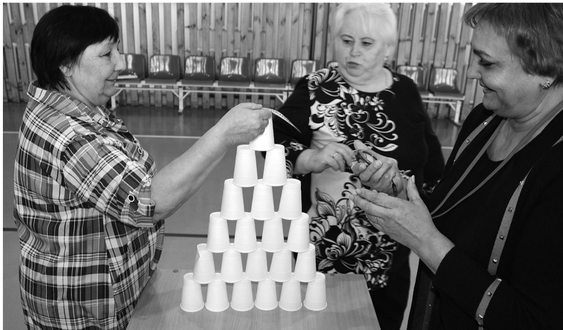
На снимках: яркие моменты спортивного праздника

Основной целью мероприятия стало привлечение к занятиям физической культурой, спортом и активному образу жизни людей с инвалидностью. В программе: игра по станциям, чайный стол, награждение победителей. В рамках мероприятия прошли семь этапов игры ("Транспортёры", "Бочка", "Подъёмный кран", "Пирамида", "Интеллектуальная станция", "Бомба", "Сортировщики"). Организовала и провела