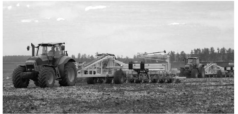
К основным сельхозкультурам, которые возделываются полеводцами «Тюменских молочных ферм», в этом году добавят рапс

ООО «Тюменские молочные фермы» группы компаний «Дамате» ведёт подготовку к посевной кампании.