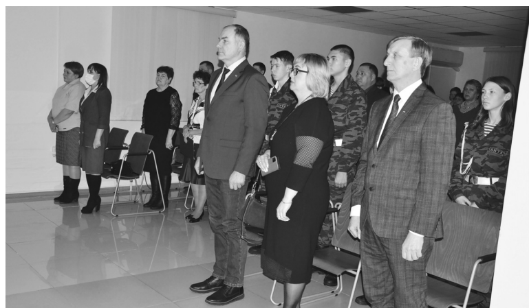
Все присутствующие на вечере почтили память героев специальной военной операции минутой молчания

зей, школу. Своим оптимизмом, добрым отношением к жиз-