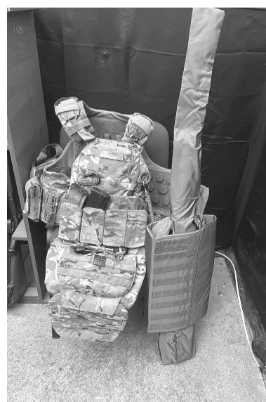
На снимке: Экипировка для Е. Рябина

Каждая пара теплых носков, каждый инструмент, каждая коробка с лекарствами — это важный вклад в общее дело поддержки наших защитников.