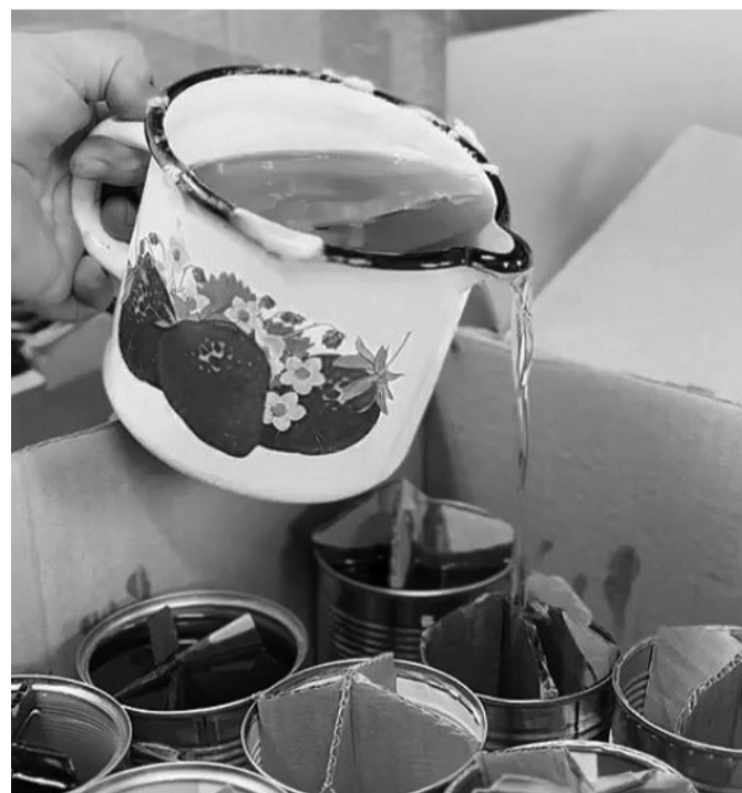
На снимке: Из-под заботливых рук одна за другой рождаются окопные свечи - незаменимая вещь на фронте