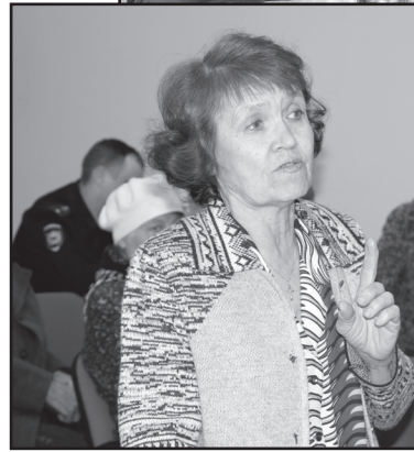
Сходы дают возможность рассказать о проблемах