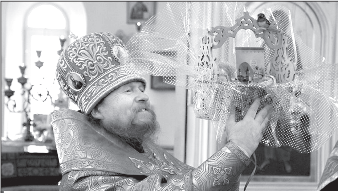
Светлое святое Воскресение. Пойдите в храм вместе с детишками. Пасхальную службу поймут все дети. Любого возраста. Всё это дух святой научит. На этих службах нас учит сам Господь. С праздником!

На снимке: епископ Ишимский и Аромашевский Тихон