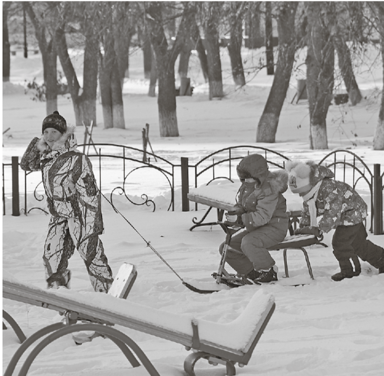
* Зимой всё здорово!