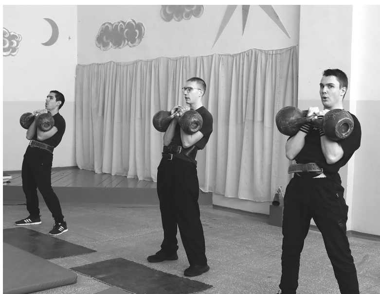
Студенты специально приезжают домой из города, чтобы поучаствовать в соревнованиях по гиревому спорту на играх и поддержать свою малую родину

Это был финальный этап соревнований. Спортсмены проверили свои силы в шести дисциплинах: сельской эстафете, охотничьем биатлоне, лыжных гонках, гиревом спорте, шашках и женском волейболе. Остальные состязания прошли ранее в посёлке Голышманово.