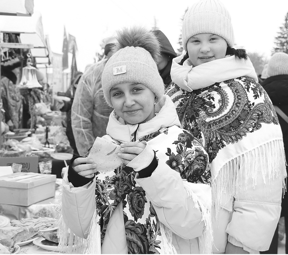
Гости праздника лакомились блинами с горячим чаем. Угощения приготовили представители общественных организаций округа

Голышмановцы простились с зимой. Народное гулянье «Масленица-блинница, весны именинница» состоялось на центральной площади окружного центра.