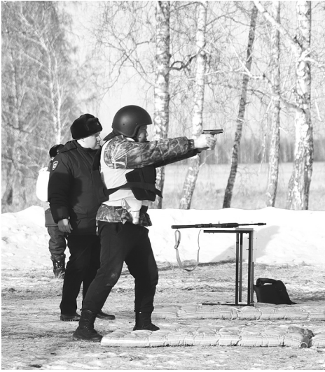
Даже на расстоянии было видно, как дыхание участников соревнований замирало на миг перед спуском курка