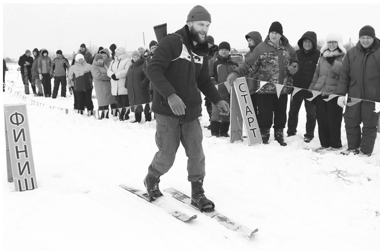
Охотничий биатлон – самый сложный этап игр. Здесь участники не имеют права на ошибку: каждый промах им обходится дорого. Наматывать штрафные круги в охотничьих лыжах без палок и наперевес с ружьём – та ещё задача