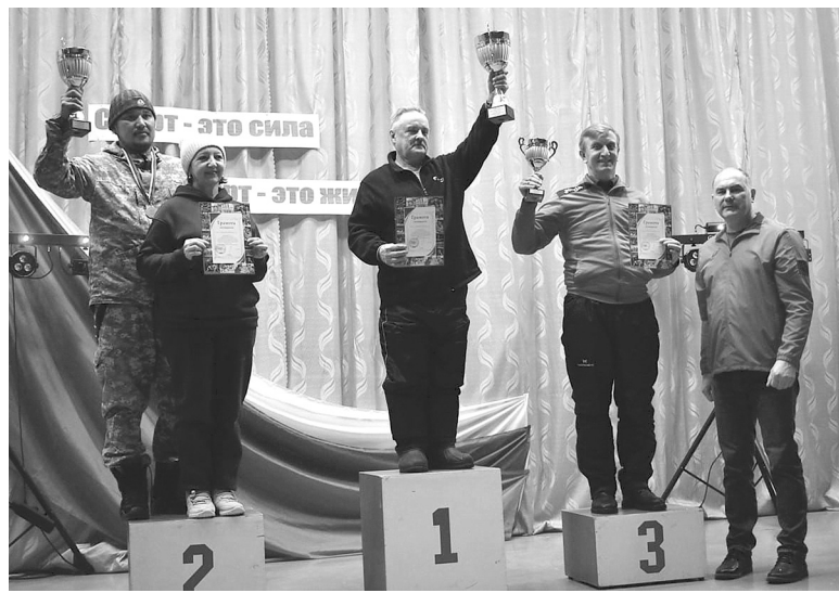
На церемонии награждения победителей и призёров зимних сельских спортивных игр поощрили кубками и почётными грамотами