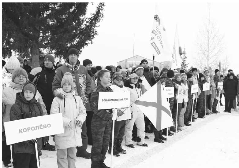
За первенство боролись 22 команды от сельских администраций, предприятий и организаций окружного центра

Первого марта в селе Королёво прошли 45-е окружные сельские спортивные игры, посвящённые 80-летию Победы в Великой Отечественной войне