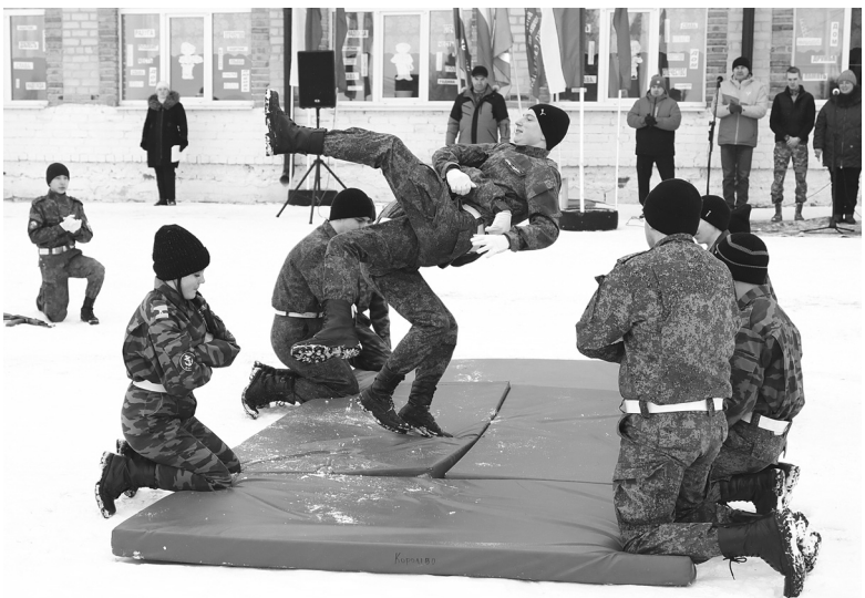
На открытии спортивного праздника выступили королёвские школьники из группы добровольной подготовки к военной службе «Поиск»