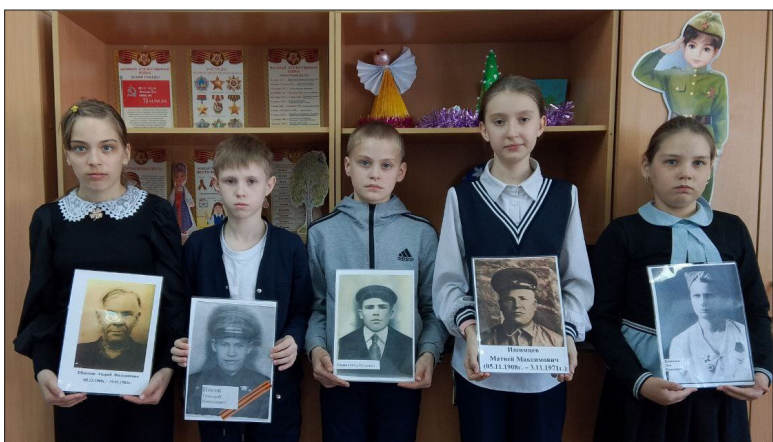
• Юрминские пятиклассники – о фронтовиках семьи.

В учреждениях района начинается оформление к 9 Мая. В преддверии Дня Победы Новоуфимский сельский клуб присоединился к Всероссийской акции «Окна Победы». Ребята, украшая окна, тем самым говорят героям Великой Отечественной войны: «Спасибо за Победу!» Они обращаются ко всем – вместе сохранять память о подвигах наших предков.