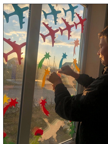
• Новоуфимцы украсили окна сельского клуба ко Дню Победы.