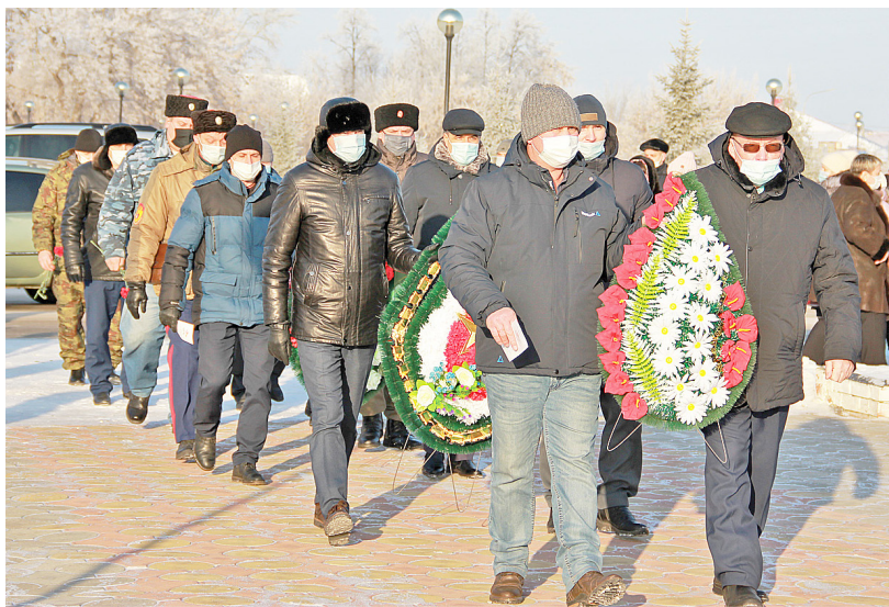
Жители района почтили земляков, не вернувшихся с полей сражений

В годы Великой Отечественной войны пропало без вести 109 человек, призванных на фронт из Казанского района. По югу Тюменской области числятся без вести пропавшими два «афганца» и шесть «чеченцев».