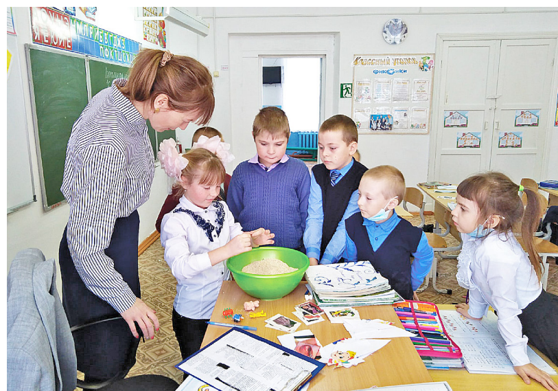
Учитель-логопед проводит для воспитанников смирновского детсада «Кораблик» занятия по мелкой моторике рук

Проведение подобных мероприятий сближает ребят и взрос-