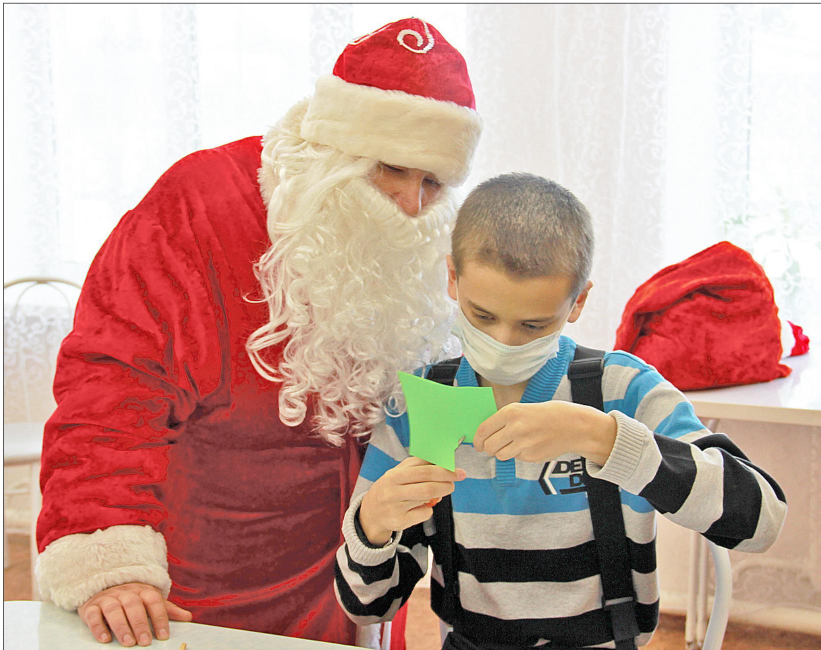
Дед Мороз помогал ребятам вырезать ажурные снежинки, тоненькие еловые веточки и миниатюрные новогодние шары

адресованы тем, кто безвозмездно трудится и помогает людям. Добровольничество стало особенно востребованным в период пандемии коронавируса.