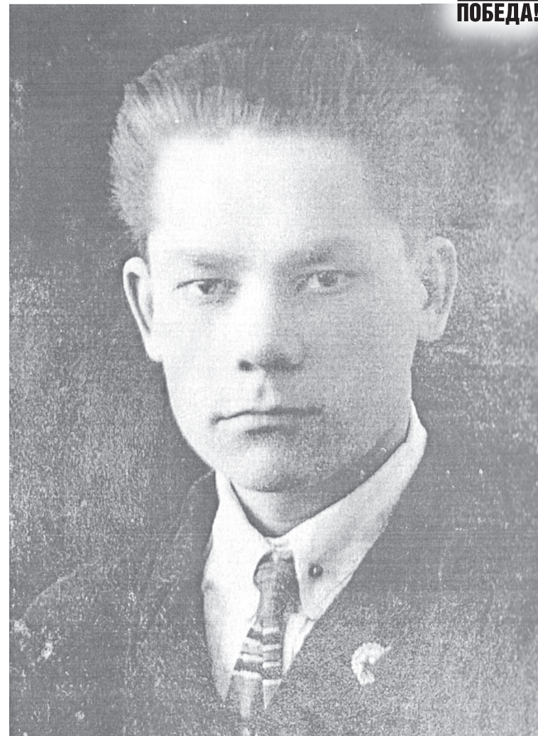
Все письма Фёдора Плоскова с фронта были наполнены теплом и любовью к близким

Это было последнее письмо Фёдора. Но, уходя в бой, он этого ещё не знал, верил в Победу и в то, что обязательно останется жив. Но враг был силен: в группе немецких армий «Север», действовавшей под Ле-