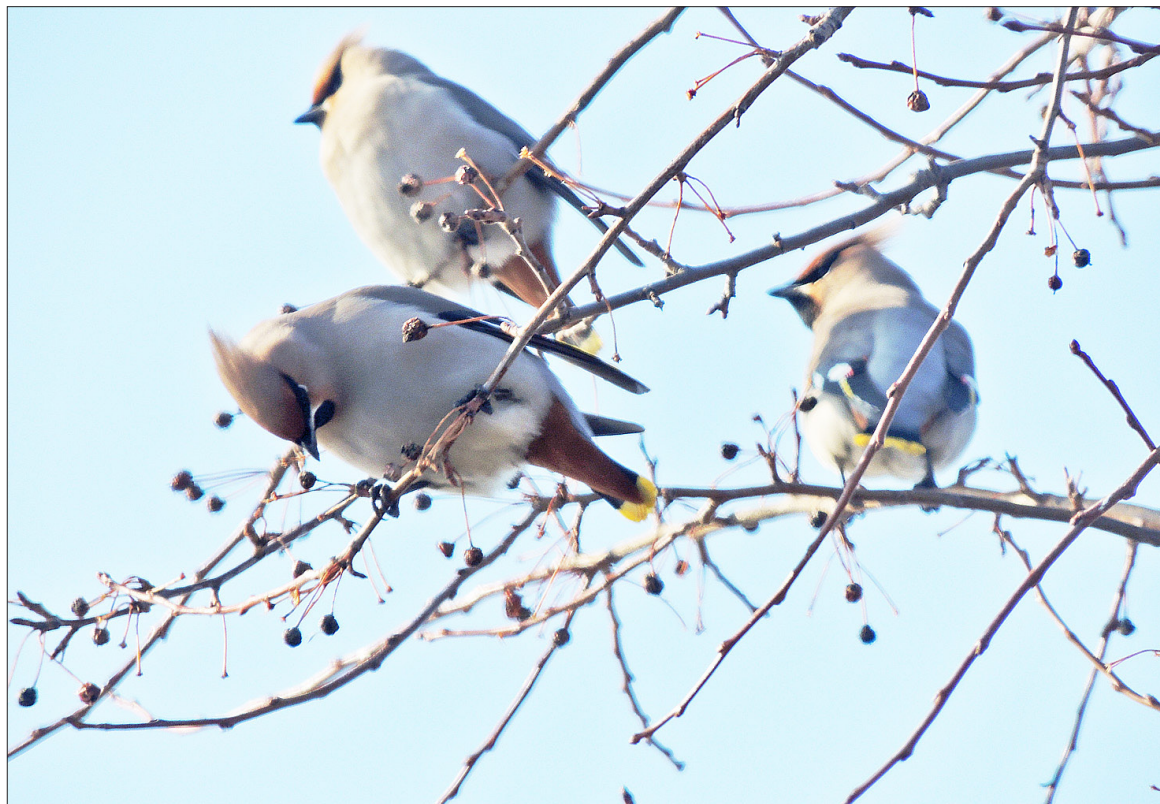
У пернатых – время обеда