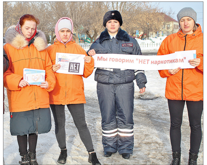
Участники акции, направленной против употребления наркотиков

сти информацию о последствиях употребления психотропных и наркотических веществ, в том числе и смертельных, то найти способы