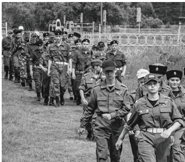
Задачи лагеря – пропаганда здорового образа жизни, развитие физических способностей подростков, формирование духовно-нравственных качеств личности, адаптация обучающейся молодежи к условиям выживания в экстремальных условиях.

«Ишимские ратники» – это неделя занятий по огневой, строевой, инженерной, тактической подготовке, военной топографии и условиям выживания. На протяжении учебного года ребята изучали армейские дисциплины в военно-патриотических объединениях на местах, а в летнее время получили возможность закрепить навыки в полевых условиях. Место проживания молодых людей – палаточный городок, развернувшийся на территории детского спортивно-