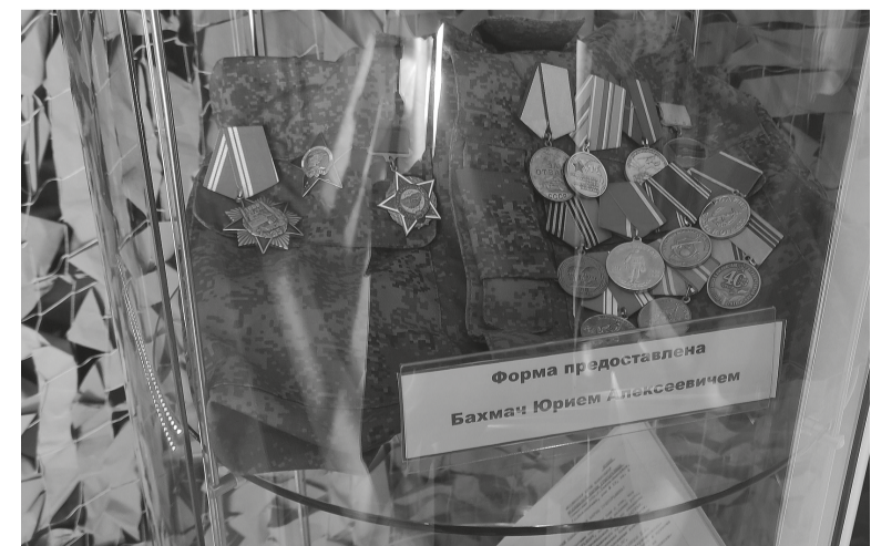
На снимке: Особое впечатление оставили личные вещи участников вооружённых конфликтов

«Знаете, фотографии можно найти в интернете, документы — в архивах, — продолжает библиотекарь, — но когда ты видишь вживую предмет, который был с солдатом