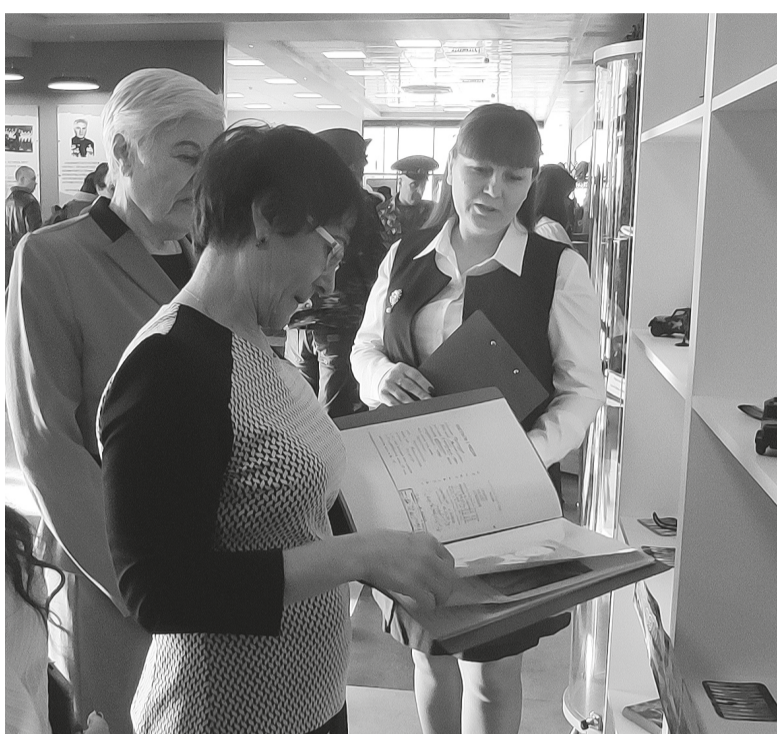
На снимке: Участники мероприятия знакомятся с материалами выставки