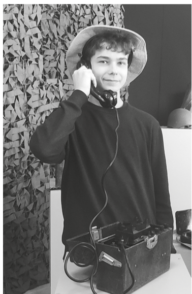
Выставка ЦКР «Броня и мужество» вызвала живой интерес у представителей всех возрастов