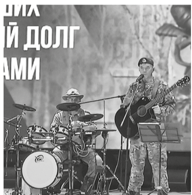
Особую атмосферу мероприятию придало выступление ВИА «От Афгана до Чечни» (Голышманов)

цветок, бережно положенный к подножию монумента, стал безмолвным свидетельством того, что подвиг героев не будет забыт.