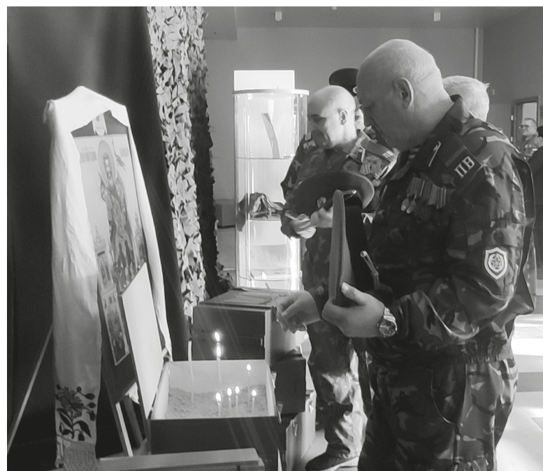
Каждый желающий мог поставить свечу за тех, кто навсегда остался на полях сражений

своим мужеством защищает нашу страну. Тех, кто, несмотря на свой возраст, шёл на афганскую войну — практически 20-летние, а кому-то ещё не было двадцати. Ребята, которые учились в наших школах, жили в наших сёлах, по призыву в армию, по зову Конституции не отклонились от обязательств гражданина своей страны.