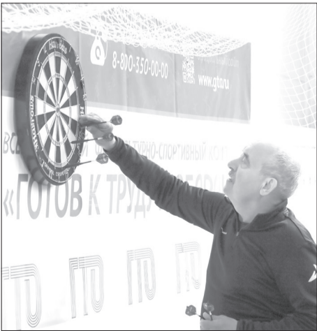
Попасть в яблочко непросто, как и выбрать правильный ход в шахматах