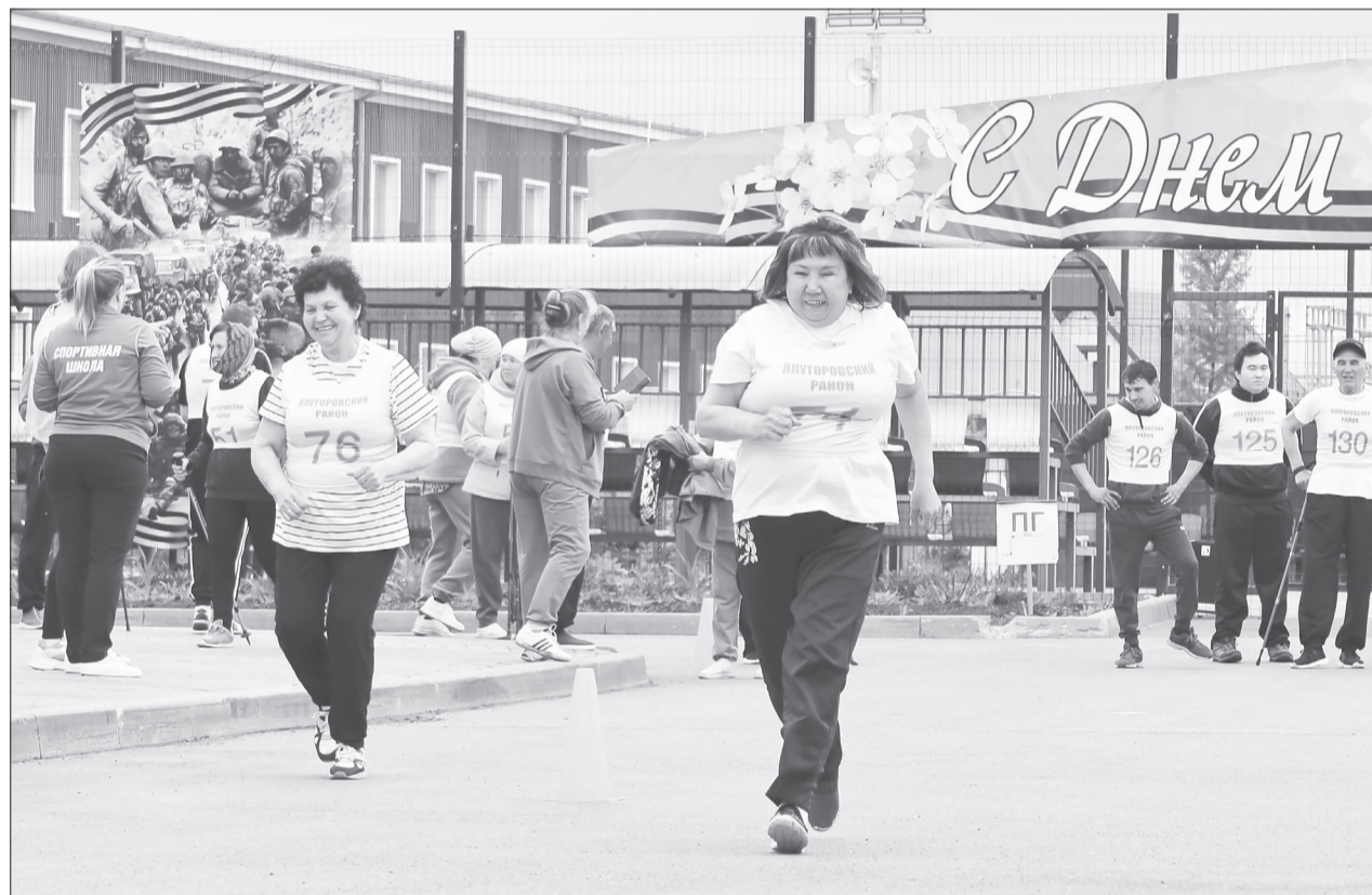
Спартакиада началась с забегов на 60 метров

В Памятном соревновались сельчане с ограниченными возможностями здоровья