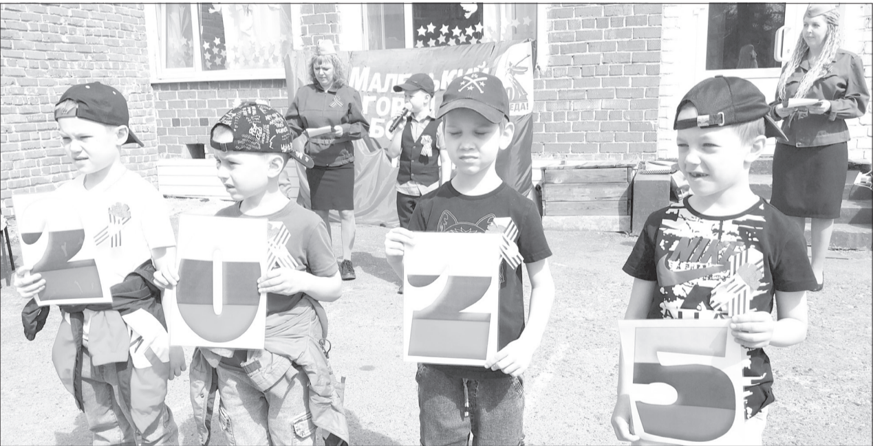
Дети были активными участниками на всех площадках фестиваля

В детском саду № 7 прошёл патриотический фестиваль