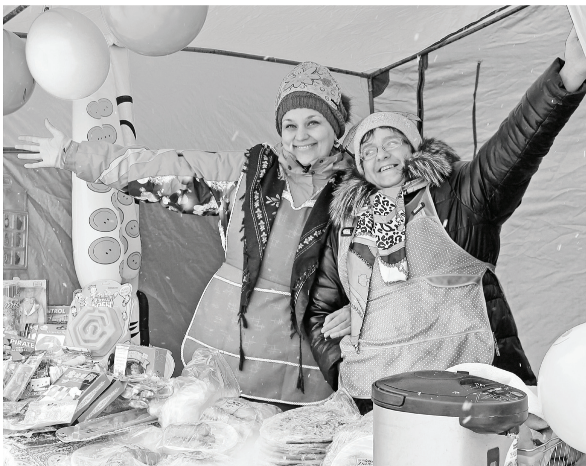
Подходи, честной народ!