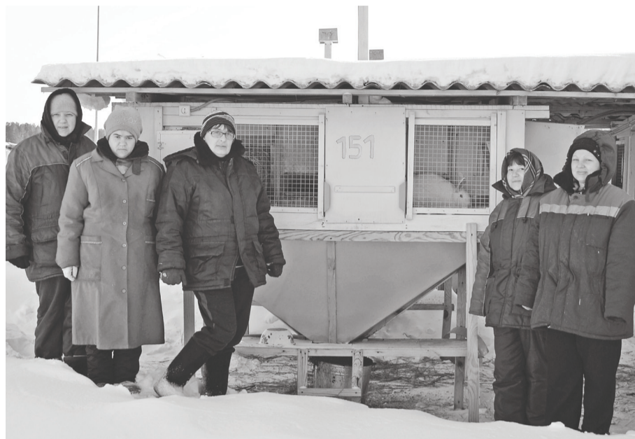
350 таких мини-ферм надо обойти этим женщинам, накормить две с половиной тысячи животных каждый день.