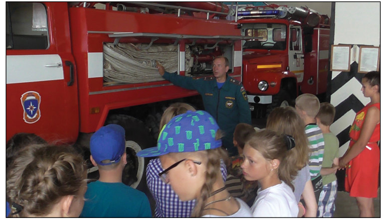
• Ребятам во время экскурсии показали, чем оснащён пожарный автомобиль.

– В рамках года пожарной охраны мы часто приглашаем детишек. Главной целью является организовать досуг ребятам и привлечь их к профессии спасателя, – сообщила заведующая канцелярией 150 ПСЧ Наталья