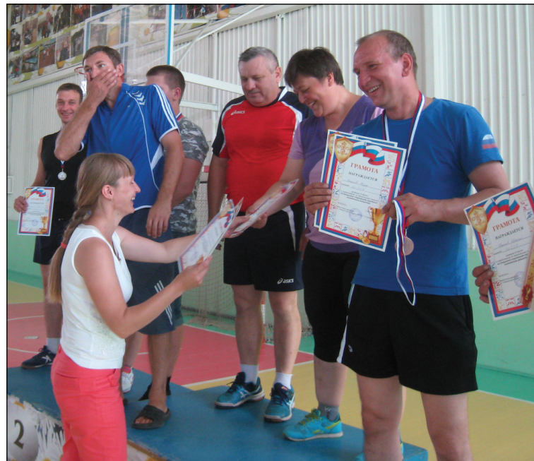
• Момент награждения победителей в настольном теннисе.