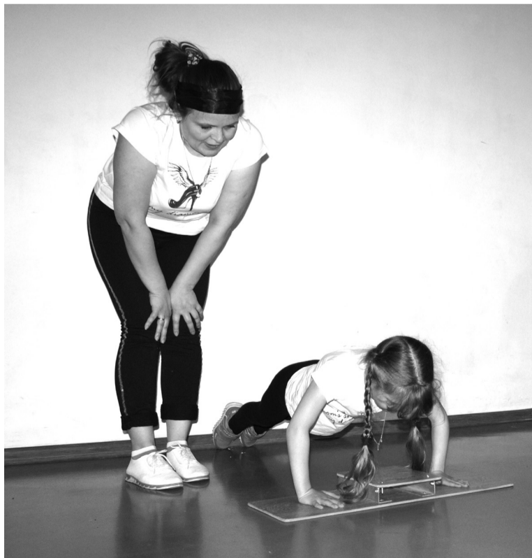
На снимке: а у мамы так не получается