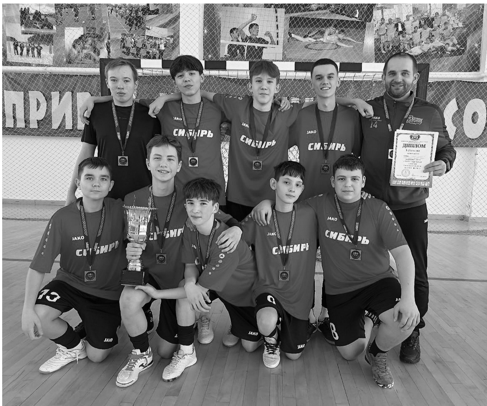
На снимке: Команда Сорокинского округа "Сибирь"

Спорт - норма жизни. Сорокинские футболисты стали лучшими в области!