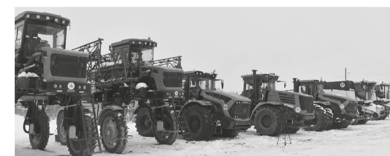
На снимке: Техника готовится к севу

А в регионе полным ходом ведётся работа по подготовке техники к посеву. По информации департамента АПК обла-