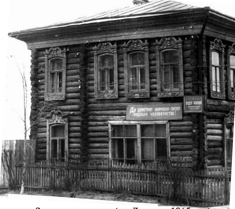
Здание милиции (ул. Ленина, 1965 год)

В январе предвоенного года в Большом Сорокино проведена двухдневная колхозная ярмарка.