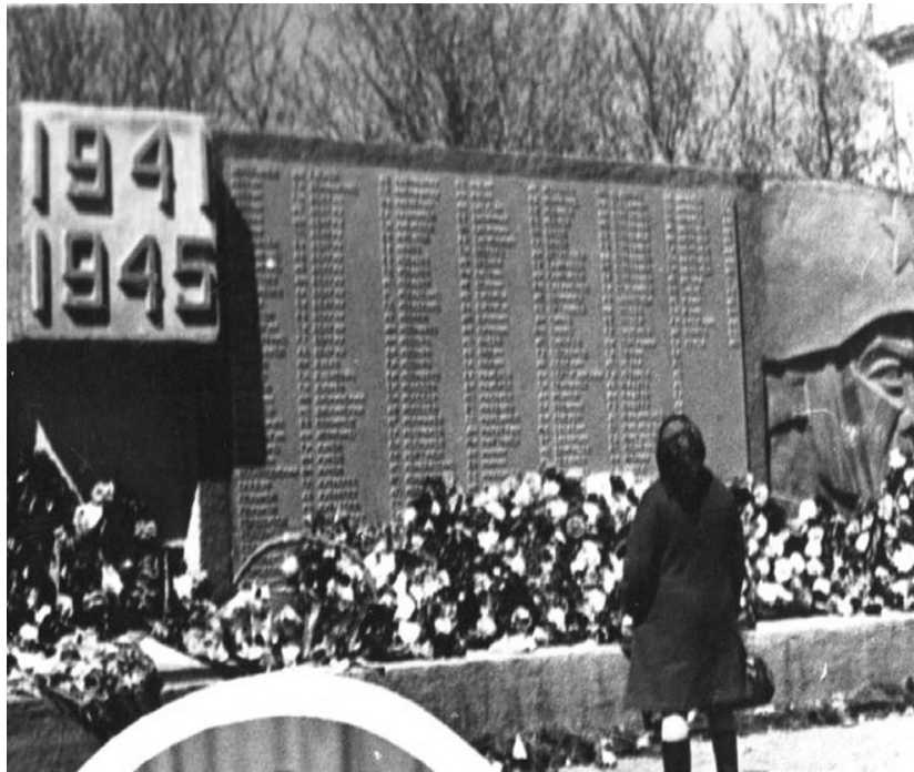
Памятник погибшим воинам-землякам (80-е годы)

Центральной улицей села считалась улица Почтовая из-за расположенной на ней почтовой конторы. В 1965 году улица получила новое имя – Ленина, пришла в упадок ввиду того, что предприятия, расположенные на его территории, были упразднены. По состоянию на 1939 год в селе Большое Сорокино действовали маслозавод, льнозавод, промкомбинат, заготконтора, МТС, ветлечебница, доротдел, сельпо, две мельницы, госбанк, народный суд, лесозаготовительная контора, контора связи, сберкасса, аптека, больница, хлебопекарня, военкомат, авторота, детсад-ясли, школа, редакция местной газеты, милиция. Зарегистрированы улицы Почтовая, Зелёная, Советская и Базарная.