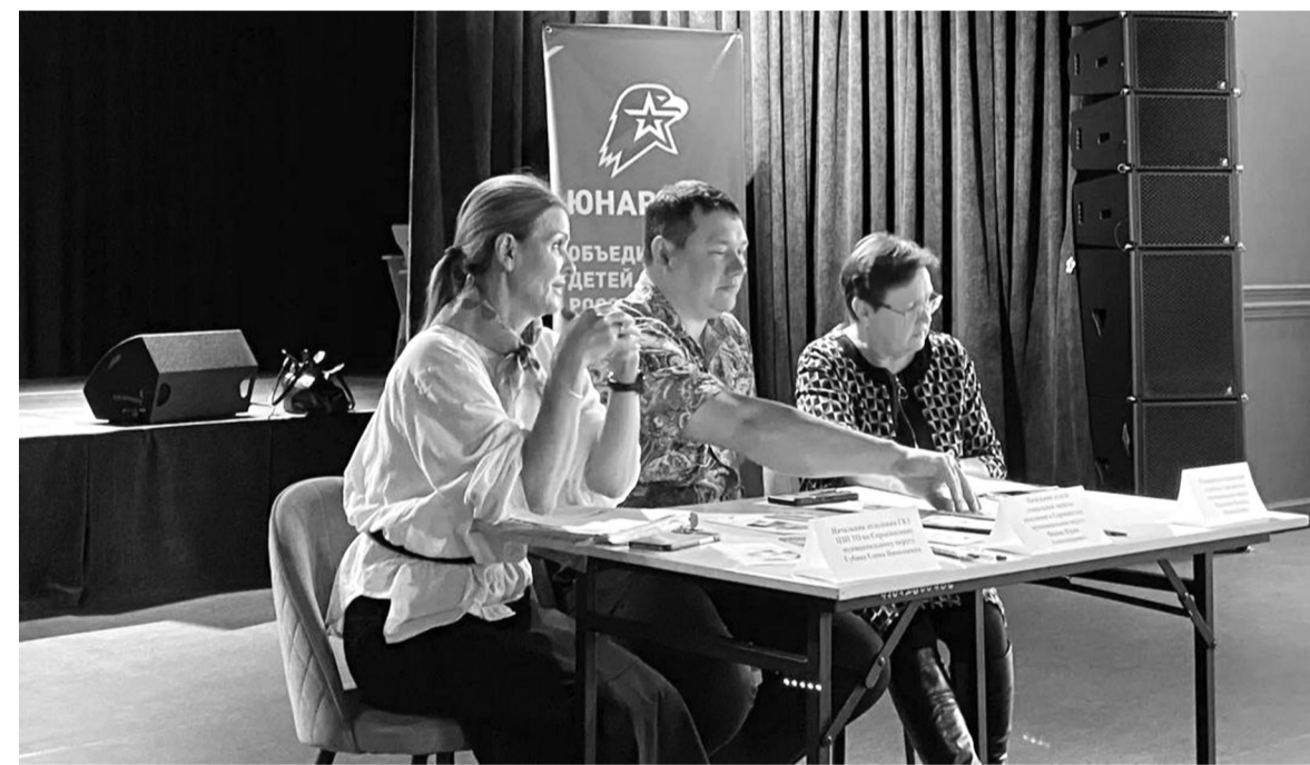
■ На снимках: специалисты отвечают на вопросы участников круглого стола

Социальный диалог. В Сорокинском округе обсудили поддержку людей с инвалидностью