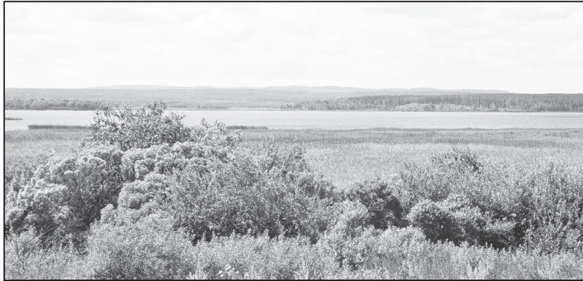
На берегу озера Чебаркуль.