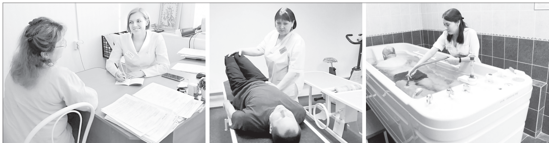
Любая процедура в «Светлом» выполняется с учётом индивидуальных показаний

Наш адрес: г. Ялуторовск, ул. Революции, 130. Тел.: 8 (34535) 3-19-07, 8-902-622-26-02 (круглосуточно)