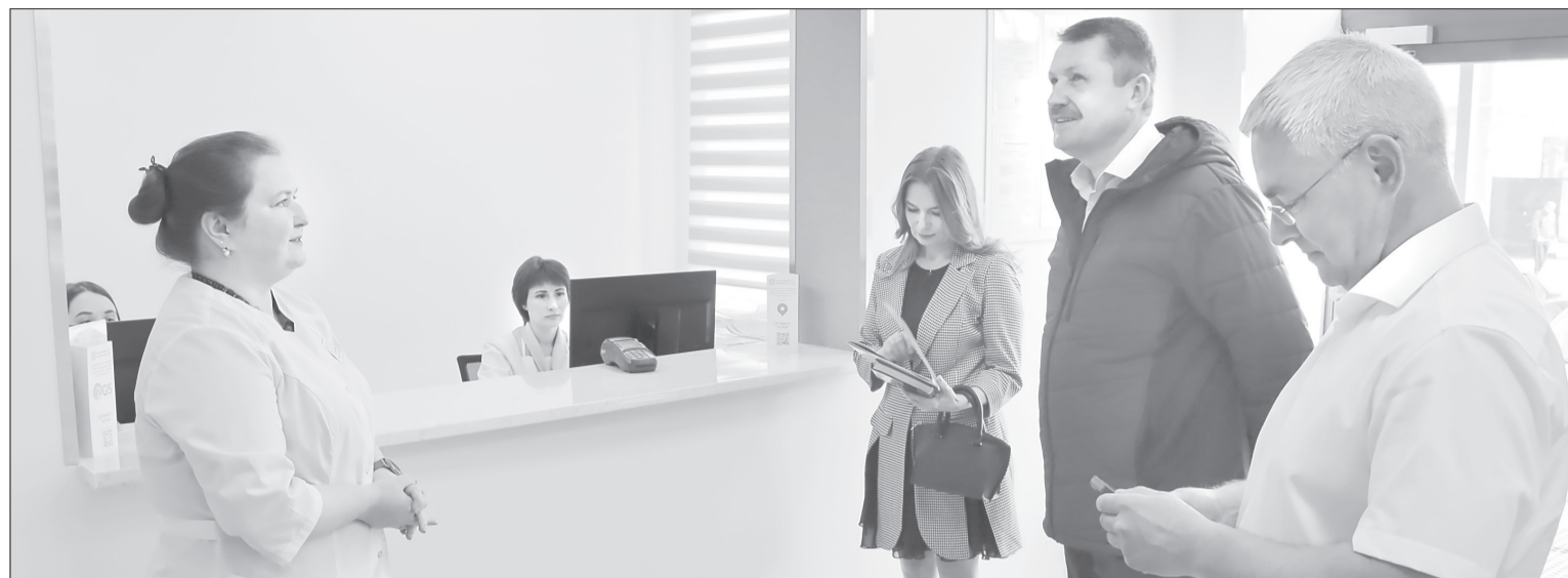
В новом медицинском центре просторная регистратура и более десяти кабинетов

Городской бизнес развивается по всем направлениям