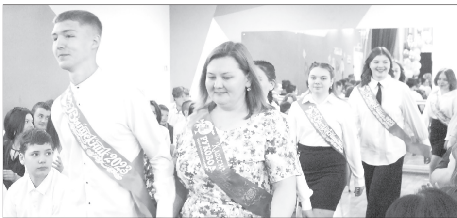
В хохловской школе нынче одиннадцатиклассников нет, поэтому чествовали только выпускников девятого